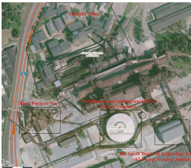
Fig. 2: Vista aérea del Patrimonio Nacional y Cultural (PNC) de Vítkovice, señalando individualmente cada objeto.

creando así la empresa minera Vitkovická. En especial, se amplió el programa de armas, en el cual se producían, entre otros, placas de blindaje para los buques de guerra austro-húngaros.