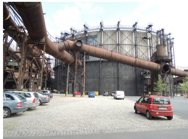
Fig. 4: Depósito de Gas reconstruido y llamado actualmente Sala Multifuncional Gong