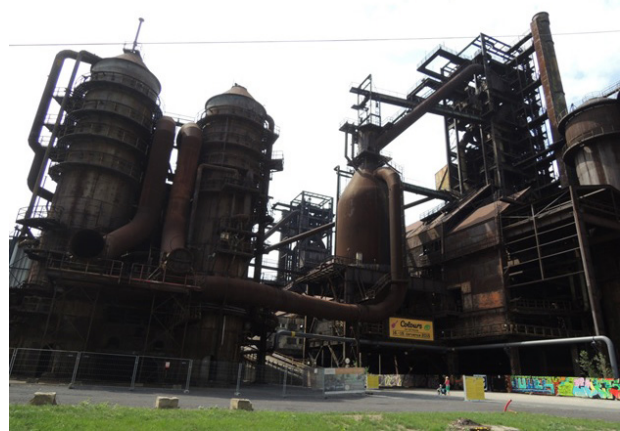
Fig. 3: Alto Horno N° 1 (al centro) con un acabado panorámico

La zona industrial en la parte central y sur del Área Inferior se ajustará a las condiciones de empresas de ingeniería mecánica de un gran valor añadido. Estas empresas producirán o suplementarán la cadena de suministro que la empresa Vítkovice necesita para su siguiente estrategia de desarrollo. El Área Inferior de Vítkovice también debe funcionar como zona de vivienda y de recreación. Desde el año 2008, este PNC también está incluido entre los monumentos históricos de los patrimonios europeos.