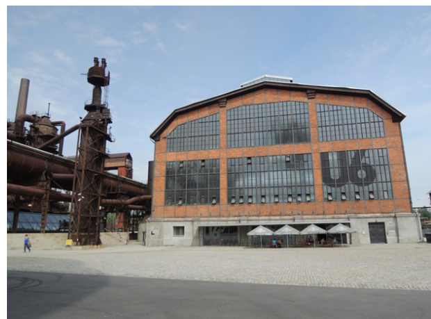
Fig. 5: Entrada al Edificio VI de la Central Energética llamado actualmente Pequeño Mundo Tecnológico U6