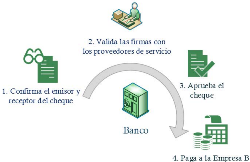
Figura N.º 3. Banco paga cheque electrónico a Empresa B.