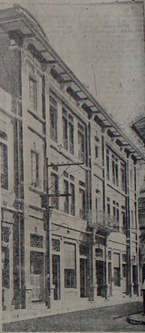
Palacio de cemento armado monolítico asísmico e incombustible, propiedad de la señora doña Leonor de Quiñónez. Este edificio de tres pisos, es parte del Hotel Nuevo Mundo. La armonía de sus líneas arquitectónicas modernas, constituye un éxito artístico y uno de los mejores adornos de la Capital. Es obra original del Arquitecto don Alberto Ferracuti.