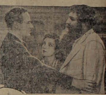
Leslie Howard, Conchita Montenegro and Mitchell Lewis in "NEVER THE TWAIN SHALL MEET"

Una escena de la interesante película Metro Goldwyn Mayer, titulada: PROHIBIDO, que el Teatro Principal estrenará mañana jueves a las 5:30 y 7:30 p. m. PROHIBIDO es una novela de amor que se desarrolla en zonas «puestas»: Norte América y el Tópico. Por lo tanto, la pasión universal cobra caracteres distintos en ambas regiones.