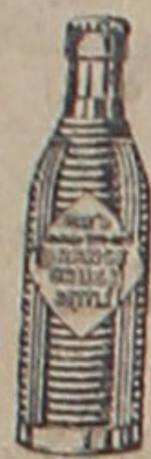
(Marca, botella y nombre registrados)

Exija siempre la botella original y rechace imitaciones