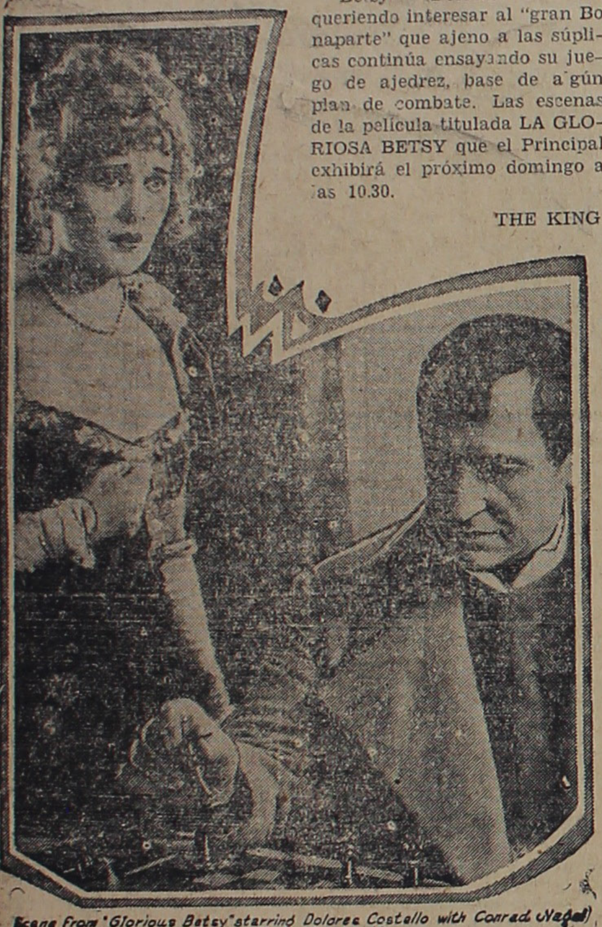
"Betsy" (Dolores Costello) queriendo interesar al "gran Bonaparte" que ajeno a las súplicas continúa ensayando su juego de ajedrez, base de algún plan de combate. Las escenas de la película titulada LA GLORIOSA BETSY que el Principal exhibirá el próximo domingo a las 10.30.