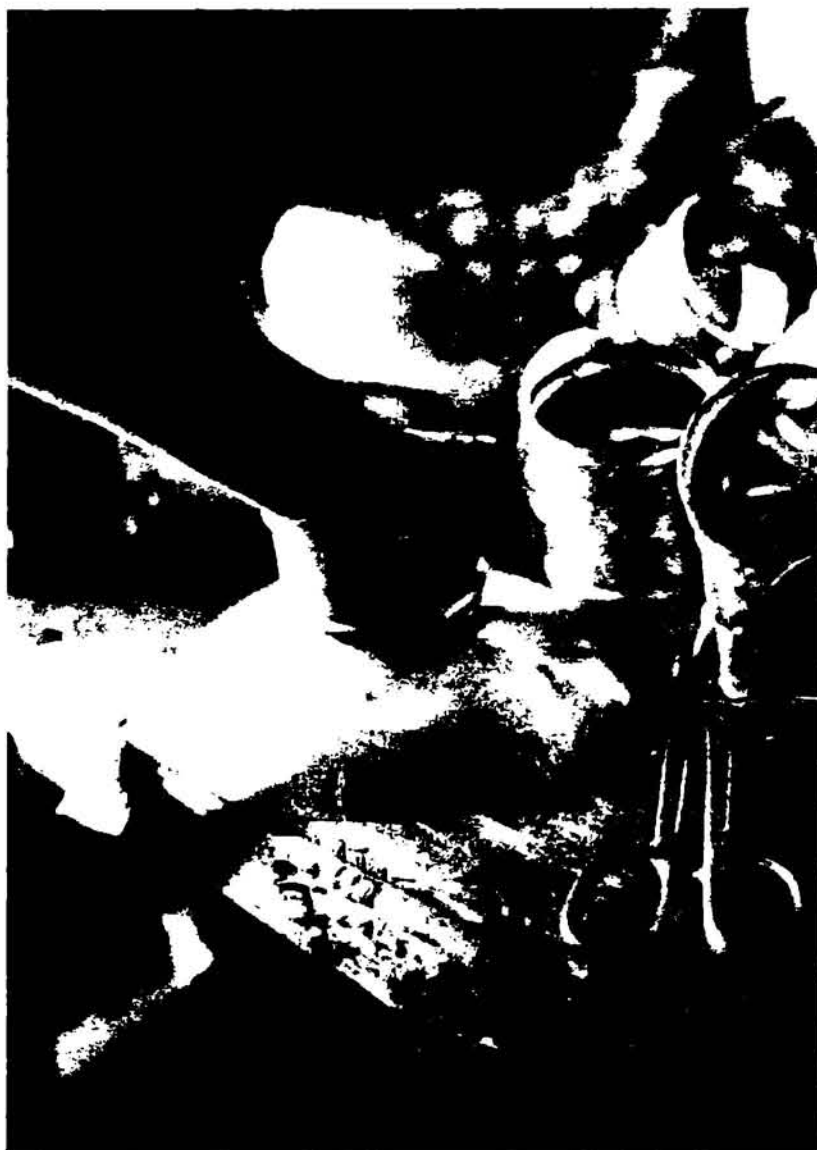
Artesano confeccionando parte de un cántaro de hojalata.

Puede considerarse que en el trabajo artesanal, una parte muy importante