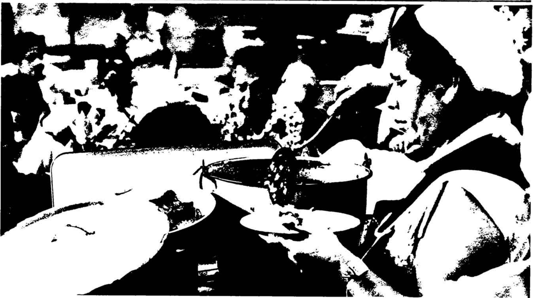
Muchas personas suelen consumir la sopa de patas como algo extra al régimen alimenticio.

La sopa de patas, es uno de los platos tradicionales que consume —casi exclusivamente— la población masculina, especialmente después de haber ingerido bebidas espirituosas. A esta sopa, en los niveles populares, también se le llama “levantamuertos”.