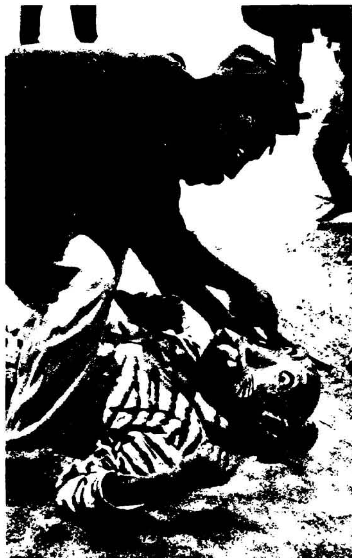
Momento de repartir la carne del tigre (San Juan Nonualco).

Sintetizando, debe cubrir los rasgos espirituales y materiales de las artesanías; es decir, una ley que pretenda normar la problemática artesanal, debe amparar todos sus aspectos para evitar caer en lo unilateral y favorecer la degradación de un componente que habla de nuestras raíces culturales.