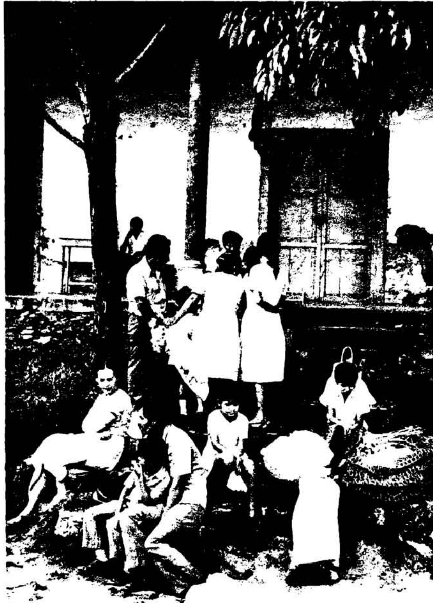
Muchas esperas sirven para que surja espontáneamente un cuento, una leyenda, un chiste u otras expresiones literarias de nuestro pueblo.

Con esta narración recopilada en Panchimalco, por el Depto. de Etnografía, Arte Popular inicia la sección de Tradición Oral, en ella se plasmará el quehacer literario de nuestro pueblo. Debemos señalar que el material que se recabe será publicado tal como la fuente lo manifieste; porque creemos que el vocabulario que se utiliza es el que le da mayor riqueza y autenticidad a esta parte del patrimonio cultural.