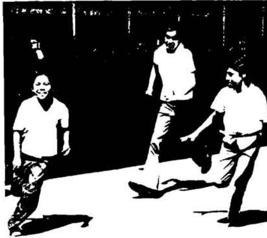
La recreación es parte fundamental de todo el proceso educativo.

Cuando se menciona el nombre del color, la vendedora mira a la fila de