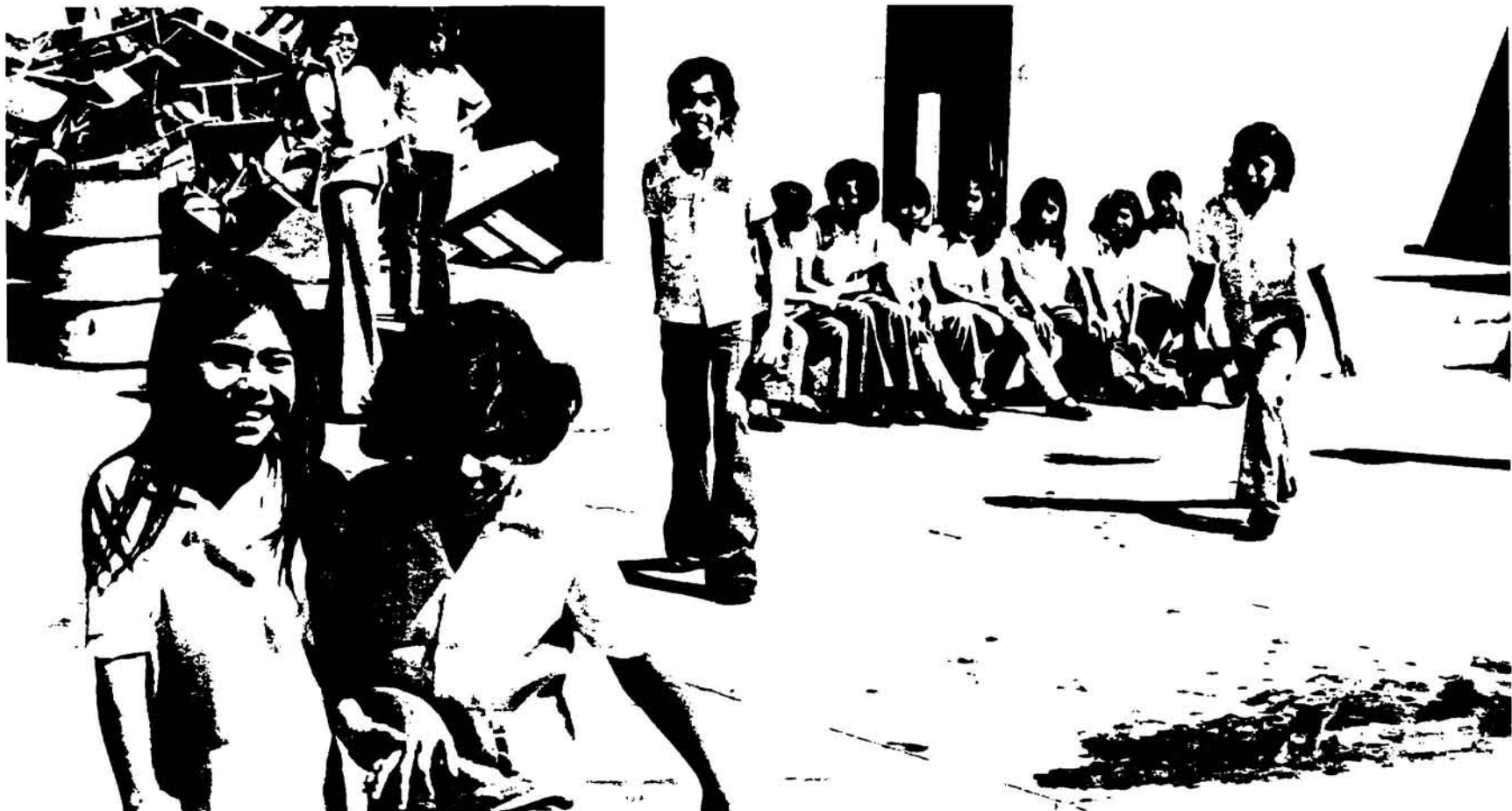
El Angel y el Diablo esperan con ansia el momento que se desunen las manos para perseguir y capturar la presa.

El juego dura entre diez y 15 minutos cuando el grupo de niñas consta de unas 12 jugadoras. Sin embargo el número de participantes no altera el pensamiento de las niñas; ser capturadas por el Angel ya que “el Diablo es malo”, opinan todas sin excepción.