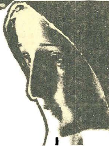
LA VIRGEN, LLORA. - Esta imagen de ojos llorosos de la Virgen Peregrina, que se venera en Nueva York y que, sin explicaciones científicas hasta ahora, ha comenzado a derramar lágrimas, como podemos ver en la fotografía tomada por el reverendo Elmo Romagosa. La estatua fue construida en madera de cedro

La judeomasonería comunista es la enemiga pública número uno de toda la humanidad; ella dirige al mundo hacia el despotismo colectivista y opresor!