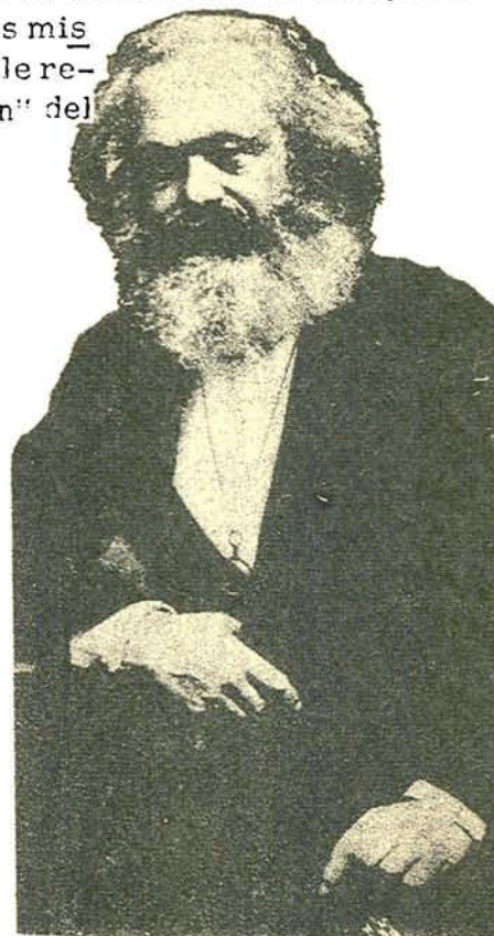
Este es a quien la ignorancia, la estupidez o el satanismo han convertido en "santo".