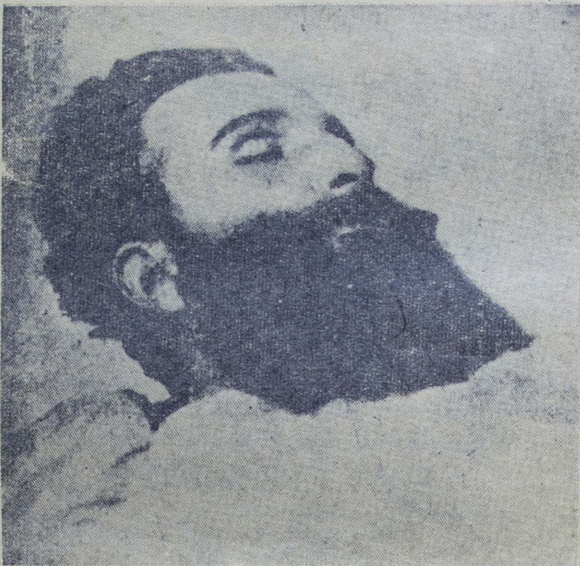
José Asunción Silva, yacente. Inspirado poeta colombiano