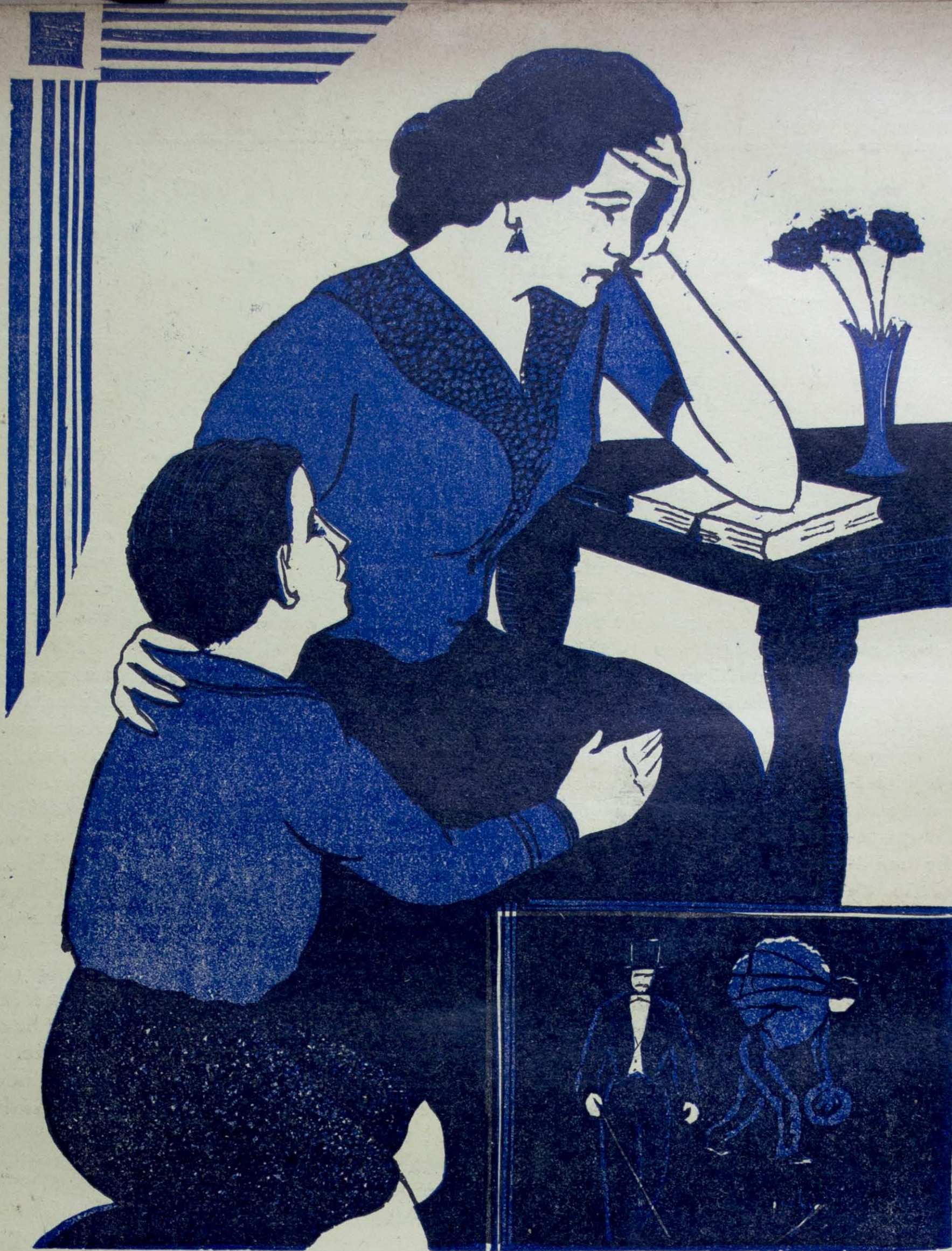
Grabado e Ilustración por Ricardo Contreras

He luchado sin tregua para alcanzar la medianía en que vivo; tengo ambición de vivir, pero de vivir como viven tantos, oyendo el ritmo aristocrático de la música de Wagner, Schubert y Bellini; aspirando el ambiente perfumado de los salones, sintiendo el roce enervante de las sedas y las pompas del encaje; escanciando en el oro cincelado de las copas de Sevres y de Etruria el licor que sólo humedece los labios de los nobles, de los dichosos de la vida, embebecidos en la romanza multicolor y poliforme de los brocados, en la endecha que deja sentir su tristeza con la simetría silenciosa e inmóvil de los frisos y los mármoles. Romper — como Petronio — la copa del festín después del placer; desaparecer de la escena, pudiendo decir con el amante de la Reina de Sabá: «que había satisfecho todos los deseos de su corazón», me parece a-