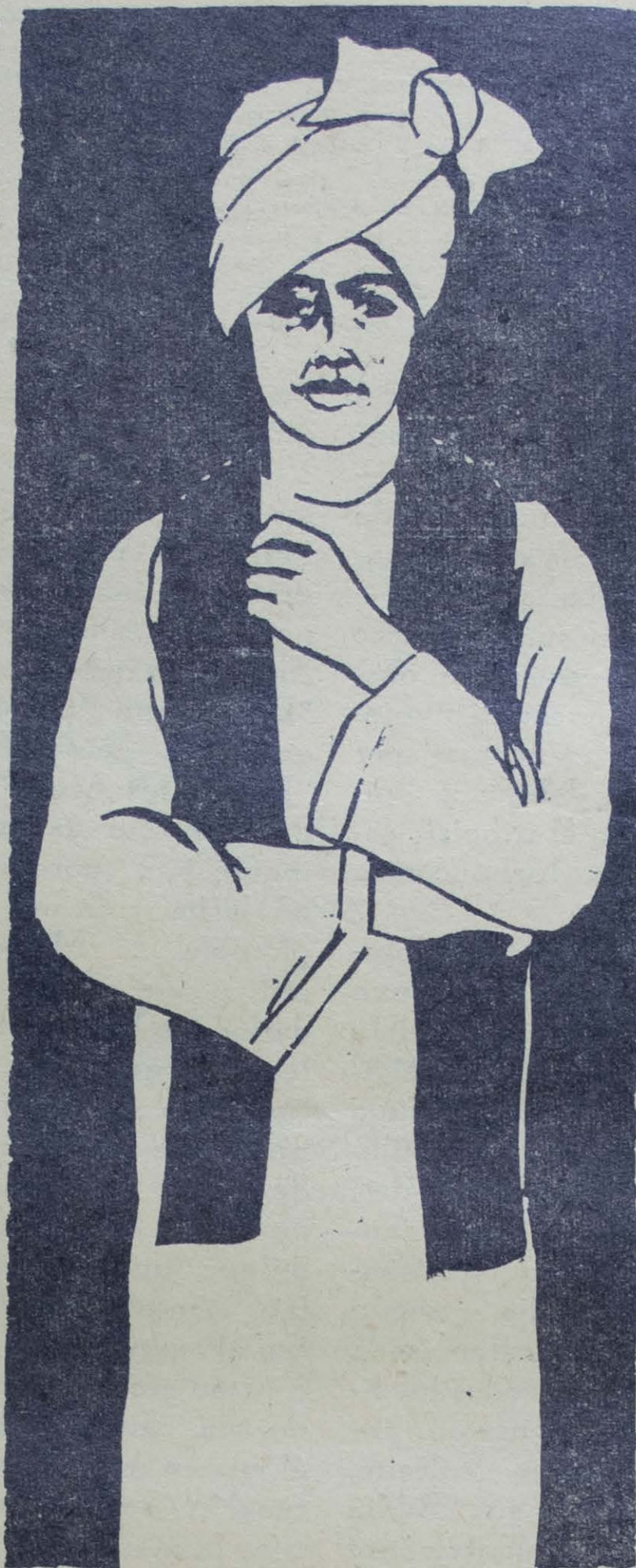
Grabado: Ilustración de Ricardo Contreras

queño rodal del dilatado azul. Juré que allí no había árbol, ni el vasto cielo — esa era mi Verdad.