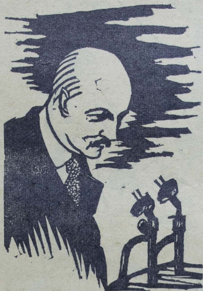
Grabado de Ricardo Contreras

H ASTA ahora, la apostilla de rigor para expresar nuestro escepticismo ante la ambición desmedida de cualquier ciudadano se encerraba en esta frase: