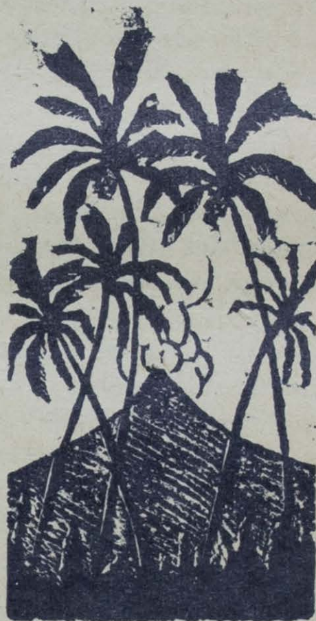
Grabado: Ilustración de Ricardo Contreras