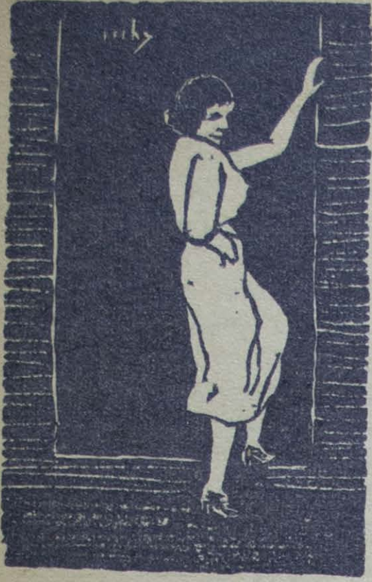
Ambas ilustraciones por Ricardo Contreras