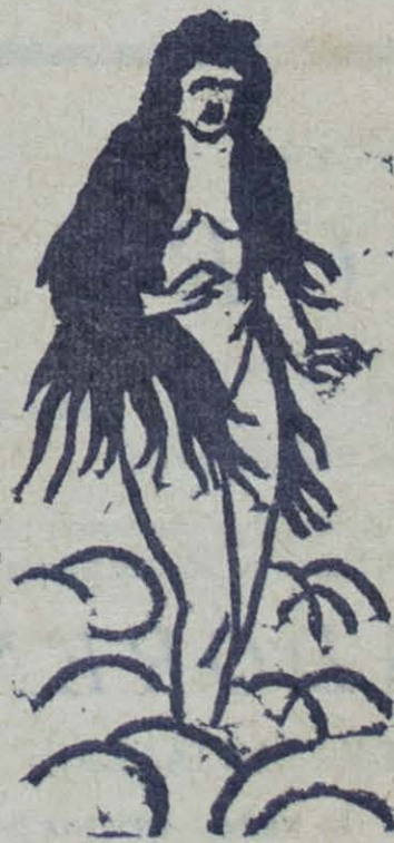
Grabado: Ilustración de Ricardo Contreras

Con cuidado, midió y mezcló todos estos ingredientes. Con esta mezcla, Twashtri hizo la primera mujer, y se sintió satisfecho de su obra,