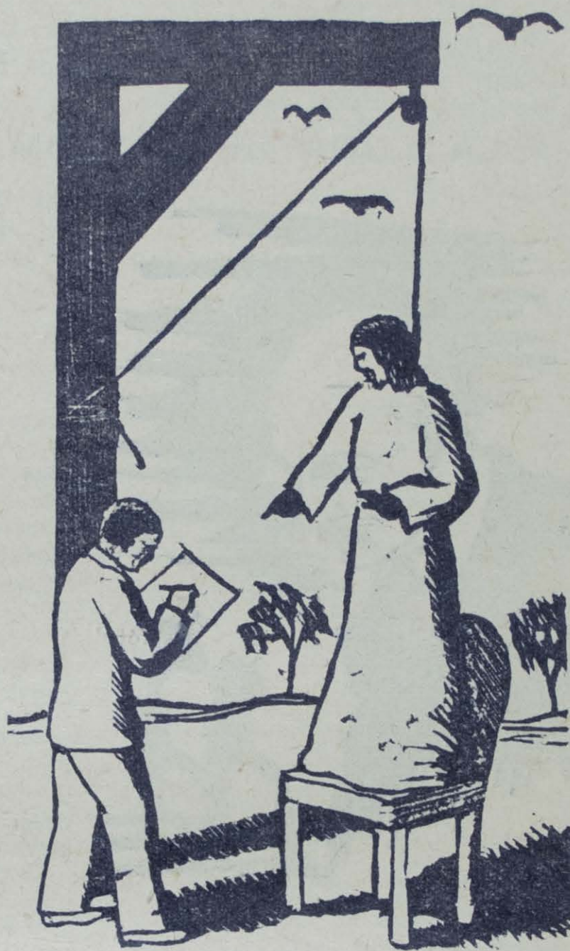
Grabado de Ricardo Contreras.

Al Dr. Tumblimbi le dejo un águila, fiel representante de su idiosincra-