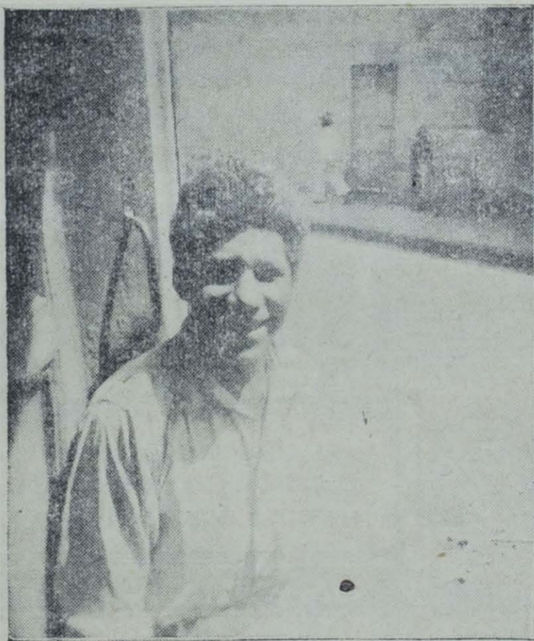
TOÑO O EL CUYO

La última visita que nos hizo, quedó grabada en la placa de nuestra "Kodak", según tene-