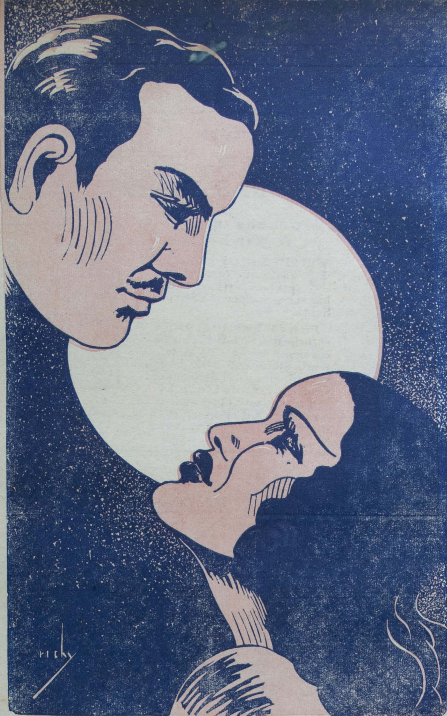
Grabado e ilustración del Br. Ricardo Contreras.