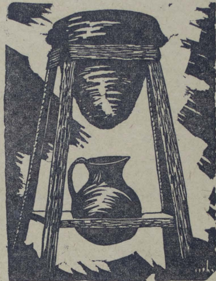
Ilustración de Ricardo Contreras.

En los próximos números iremos publicando los trabajos a que alude Cardona Peña en su carta.