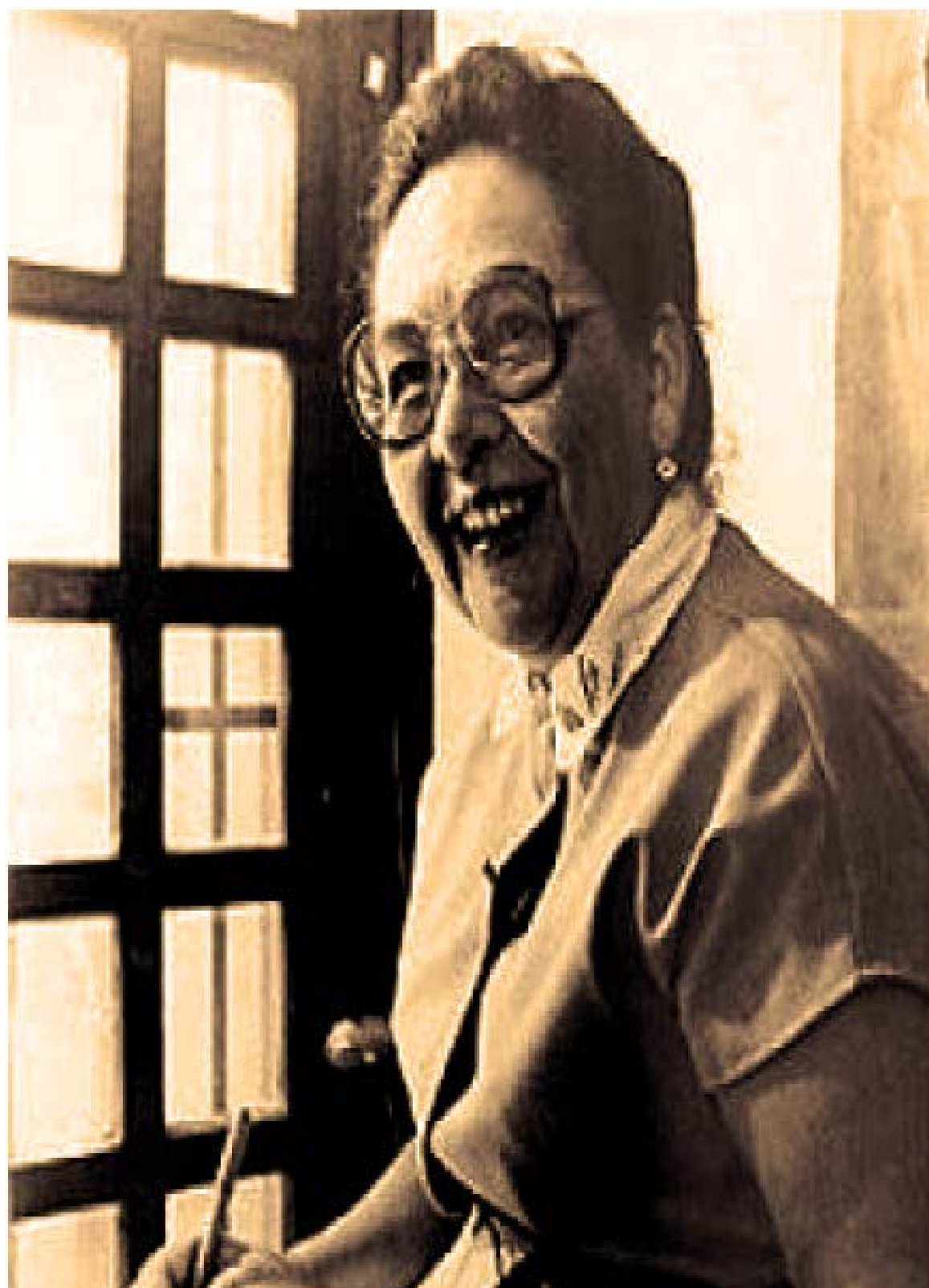
Dra. Mélida Anaya Montes (Ana María)