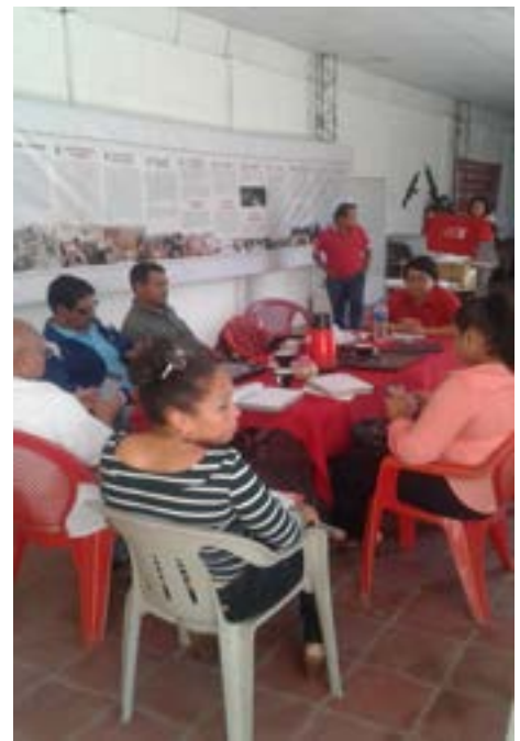
Reuniones de trabajo de la Secretaría de Memoria Histórica del FMLN