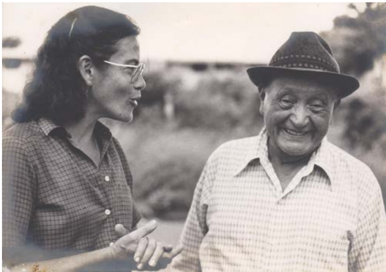
Managua, Nicaragua, 1983.

Falleció en San Salvador la mañana del 23 de junio de 1993.