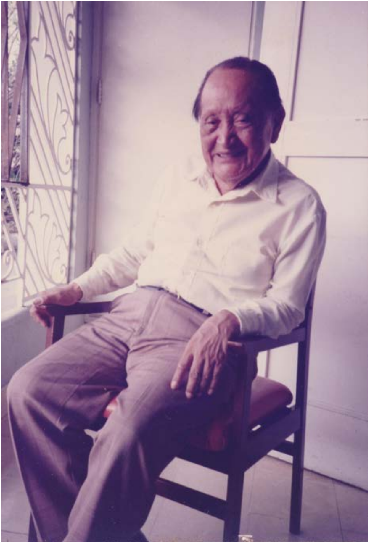
Managua, Nicaragua, 1983.