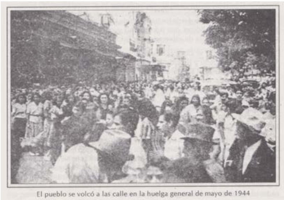
El pueblo se volcó a las calle en la huelga general de mayo de 1944

Para los acontecimientos de abril y mayo de 1944, también contemplaron la Lucha Armada como elemento necesario.