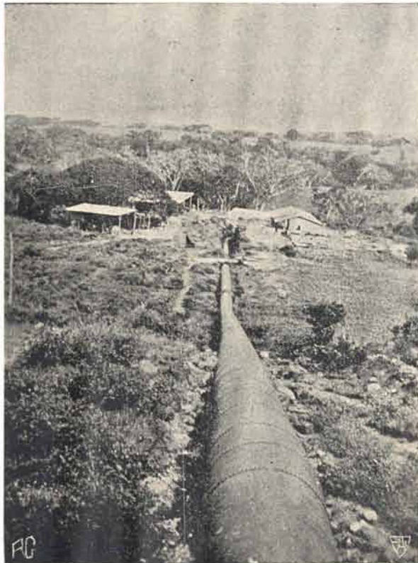
El tubo que lleva el agua a la turbina en la planta hidro-eléctrica del Río Sucio.