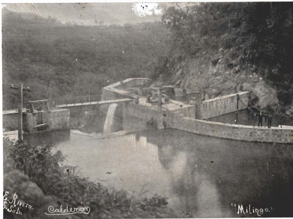
La Presa de Milingo