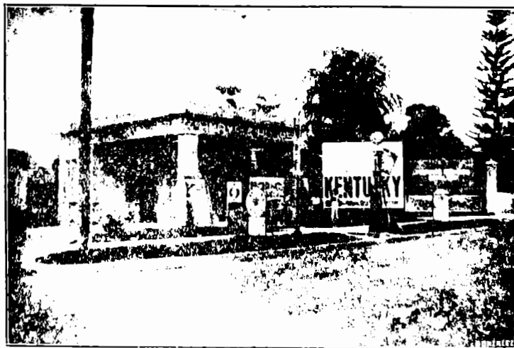
AMAYA & ROJAS - San Salvador - Tres Estaciones.