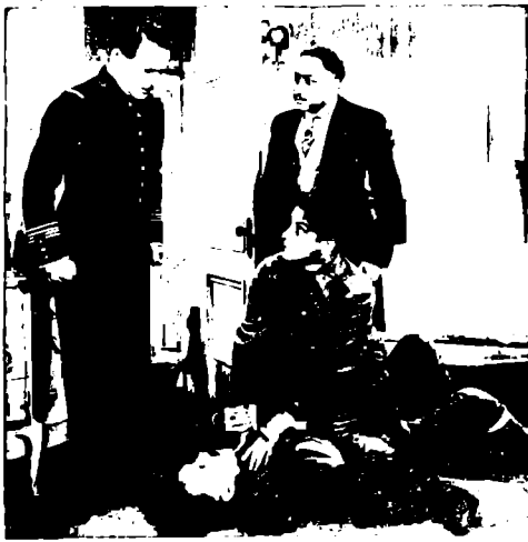
Una escena emocionante de la primera pelouca en español, toda a colores naturales, que se titula: DE LA SARTEN AL FUEGO, film umbre de la Fox y estreno del Teatro Nacional para el próximo domingo a las 10.30 a. m. y 3.30 p. m., y en el Cine Popular a las 6.45 y 9.10 p. m.

Se necesitan varios MILES DE COLONES para adquirir un buen equipo Radiológico-Radioterápico, con Terapia Profunda, y una dotación de Radium suficiente para la campaña contra el Cáncer; pero el patriotismo, la caridad, el recuerdo de víctimas queridas y hasta la defensa personal, deberán contribuir para mucho más.