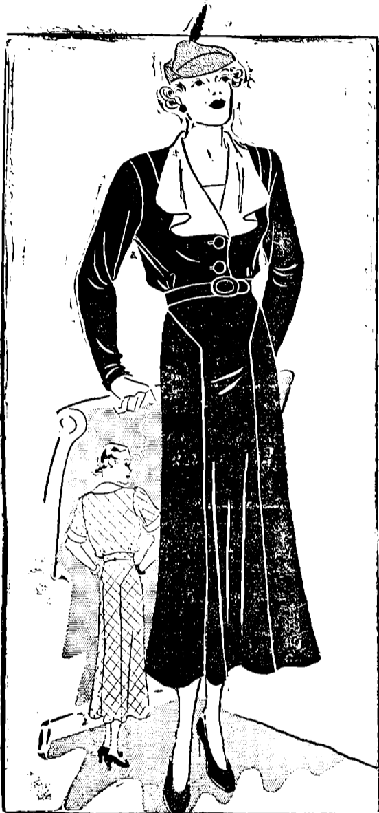
Vestido muy bien Entallado Para Usar Durante el Dia

1936-B.—Es una gran inversión verdaderamente, el emplear dinero y tiempo confeccionando un vestido semejante al modelo que les presento. Es muy práctico y atractivo para cuando se tienen reuniones en la casa.