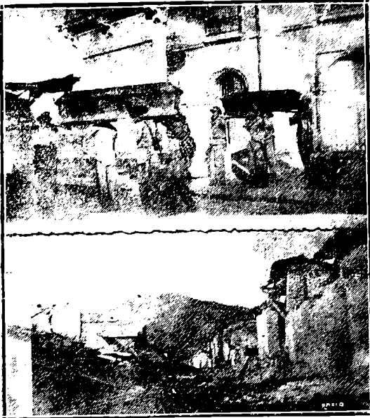
ASPECTO DE LA CATASTROFE VICENTINA

Mañana por la tarde llegará a Cutuco gasolina expresada con auxilio Gobierno y Cruz Roja Nicaragüense, cantidad aproximada veinte toneladas punto. Ruego avisarlo Gobierno y Cruz Roja Salvadoreña y agradecerle ir al —Pasa a la 4a. Pág. Col. 3a.—