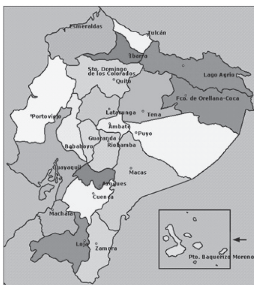
Imagen1: Diócesis y ciudades de Ecuador donde se ha ejecutado el proyecto

• Miles de estudiantes y maestros de cualquier centro educativo, público o privado, que tienen acceso al portal educativo.