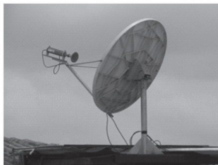
Imagen 4: Muestra de antena satelital

El proyecto incorpora una topología basada en las comunicaciones satelitales bidireccionales entre el CPC y la totalidad de las aulas de informática, integrando los servicios de INTERNET con el sistema de videoconferencia.