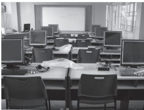
Imagen 2: Ejemplo de equipamiento en aula

Se han instalado un total de 512 aulas distribuidas por todo el país, equipadas con 5, 10, 15 puestos y grupos individuales.