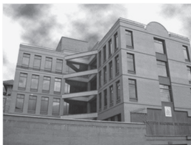
Imagen 3: Lugar donde se ubica el Plan Amanecer

La creación del CPC ha supuesto la habilitación de un espacio físico para los, aproximadamente, veinte integrantes de la UGT y de la UGP