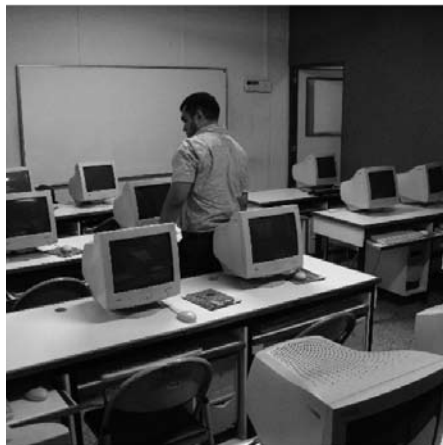
Nodos de trabajo

es decir, de incrementar sus recursos y rendimiento a las necesidades solicitadas de manera efectiva y reducir costos. Aunque la mayoría de las veces se habla de escalar hacia arriba, es decir de hacer el sistema más grande, no es siempre necesario. Muchas veces interesa hacer el sistema más pequeño pudiendo reutilizar los componentes excluidos.