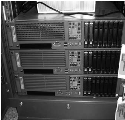
Servidores de núcleo de las tres arquitecturas

Se pueden distinguir dos épocas en las cuales los problemas que han provocado la aparición de sistemas paralelos y distribuidos han sido diferentes: