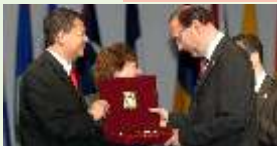
Dr. Peter Piot Director ejecutivo ONUSIDA, quien vino en calidad de Secretario adjunto de las Naciones Unidas y a quien el Sr. Alcalde de San Salvador le hizo entrega de las llaves de la ciudad como huésped distinguido.