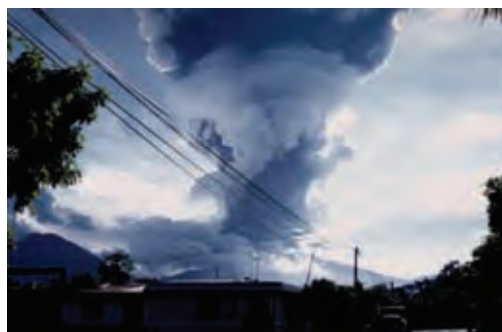
Angeles Guardianes sembrando árboles en el LAGO DE COATEPEQUE, Santa Ana, en zona afectada por la erupción del volcán ILAMATEPEC, ocurrida el 10. de octubre de 2005.