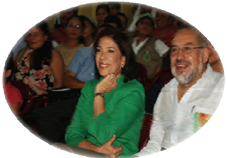
La vicepresidenta de la República Ana Vilma de Escobar, acompañando el Foro de Guardianes en la Zona Occidental en el 2007.

Durante el año escolar trabajan 10 talleres educativos sobre temas, que generan en sus participantes, conocimientos y actitudes que les comprometen consigo mismos y con las comunidades a las que pertenecen, pero desde la mejor inter actuación posible, con los recursos naturales en los cuales se encuentren habitando.