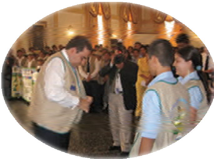
El señor Presidente de la República, Elías Antonio Saca, nombrado en esa mañana Presidente Honorario de los Guardianes Ambientales, recibe de los niñ@s el chaleco y la gorra como Guardián Ambiental Honorario.

Exactamente es el compromiso que el Programa de Educación No formal GUARDIANES AMBIENTALES, está implementando en El Salvador, registrando para el 2008 a 12,500 jóvenes líderes, pertenecientes a 500 centros educativos del país.