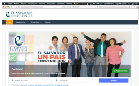
Figura 4. Vista del entorno principal de la plataforma web

Como resultado de la aplicación de estas normas se ha creado una aplicación web accesible y adaptable a diversos dispositivos con los que los usuarios se conectan a Internet, tales como computadoras, tabletas y teléfonos inteligentes.