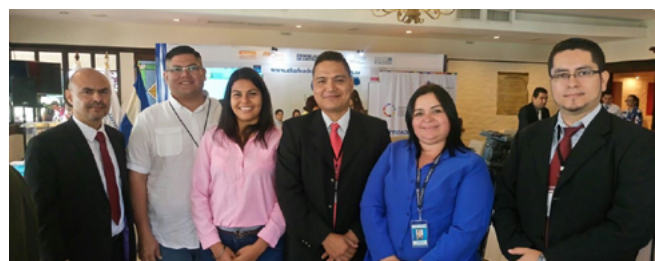
Figura 6. Evento de lanzamiento de la plataforma web

Esta plataforma fue lanzada por CONAMYPE conjuntamente con ITCA-FEPADE en el año 2016.