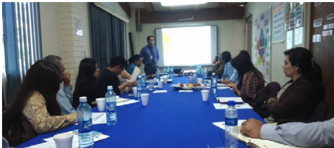
Figura 2. Elaboración de lista de funcionalidades del proyecto con la colaboración de miembros del Ecosistema Nacional de Emprendimiento

En el marco de Scrum, una de las primeras actividades realizadas consiste en determinar las funcionalidades (Product Backlog) que los usuarios esperan que el producto final posea. En ese sentido se logró con CONAMYPE identificar una lista de 21 funcionalidades, donde participaron miembros del Ecosistema Nacional de Emprendimiento, formado por emprendedores, instituciones de educación superior e instituciones financieras, entre otras.