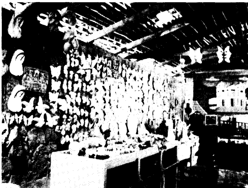
Venta de artesanías en un restaurante de Alegría, Usulután

En el conjunto sector servicios la colocación de créditos para el año 2009, llegó a la cantidad de $636 millones de dólares y para el 2011 de $ 632 millones; indicando que el crédito prácticamente se encuentra estancado. Entre los factores que han afectado el comportamiento de la