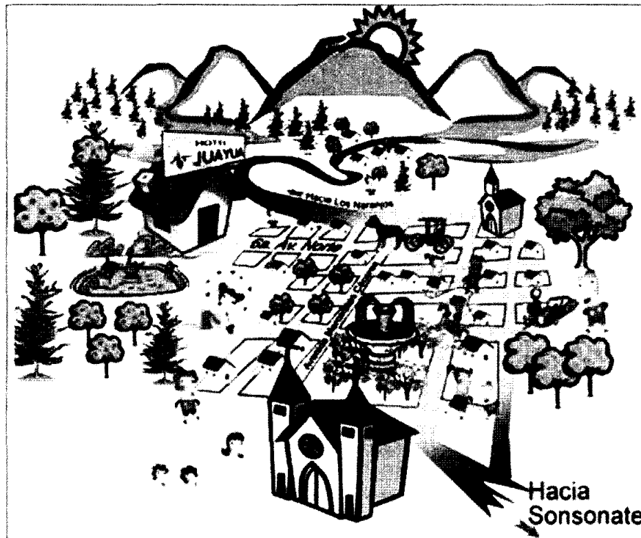
Promocional de la Ruta de Las Flores, Sonsonate

No hay que ver al turismo en función de seguir explotando el consumo interno, hay que buscar nuevas fuentes de dinero, en áreas que puedan ser protegidas de los acuerdos comerciales con el TLC. No hay