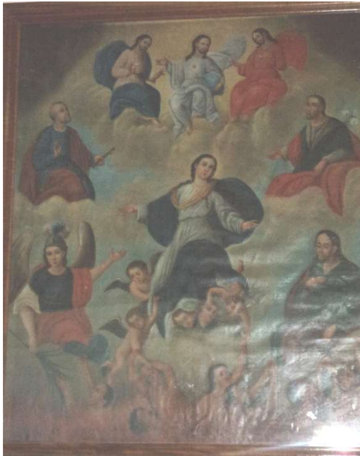
Imagen 44. Cuadro. Al parecer intervenido, con oleo, Nuestra Señora de la Asunción. Conocido como las ánimas, se encuentra en el barrio Asunción de Paleca. En los templos de Ciudad Delgado es el único que está en exhibición, de los reportados en las visitas pastorales y demás fuentes históricas.