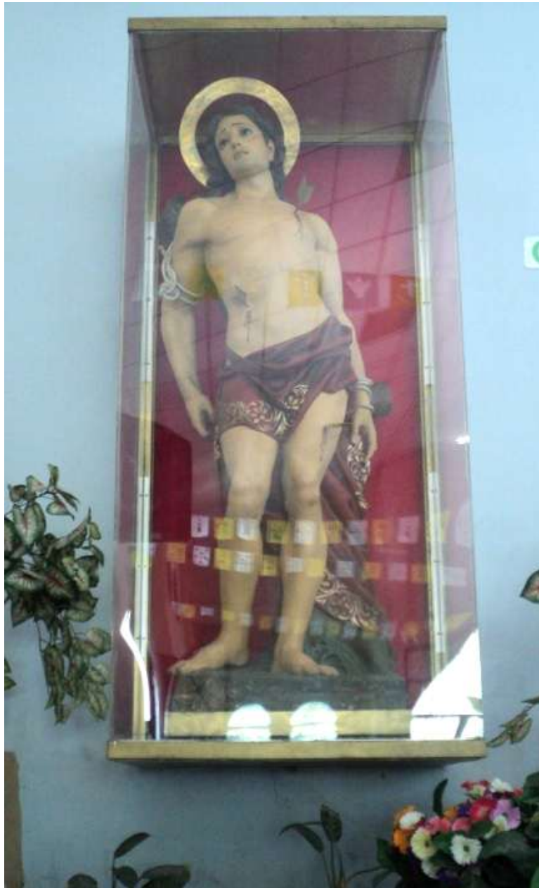
Imagen 34. Imagen de San Sebastián Mártir, talla de bulto, policromada, restaurada, se encuentra en la iglesia del barrio San Sebastián.