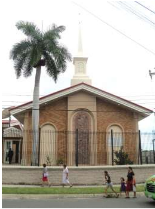
Iglesia de Jesucristo de los santos de los últimos días (Mormones).