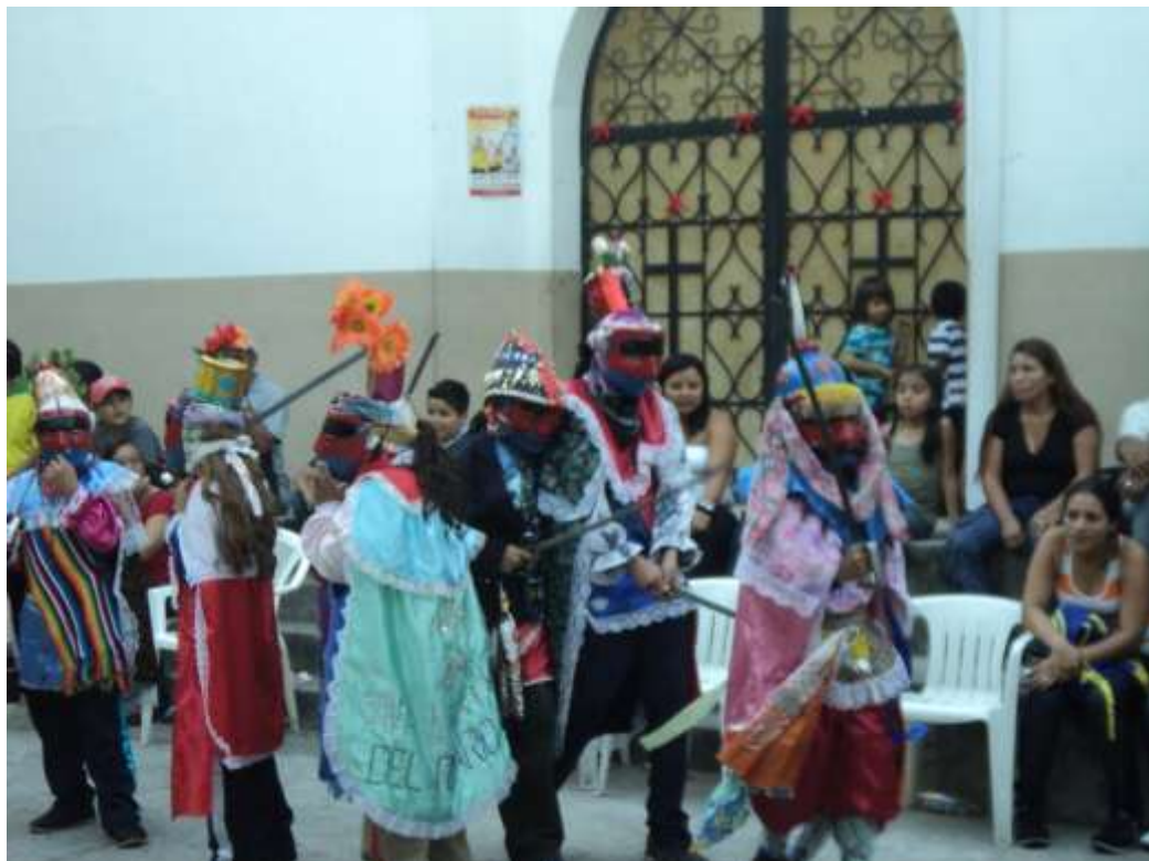
Imagen 49. Escena de la danza de moros y cristianos en el atrio de la iglesia San Sebastián.

De la misma manera, el que había representado el papel de Herodes o de Herodías y los soldados que durante el baile habían acusado o hablado contra los santos, venían también a confesar su crimen y a pedir la absolución.”