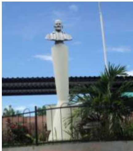
Imagen 9. La grafica muestra el monumento al prócer centroamericano Dr. José Matías Delgado. Posiblemente fabricado en los talleres Ferracutti.