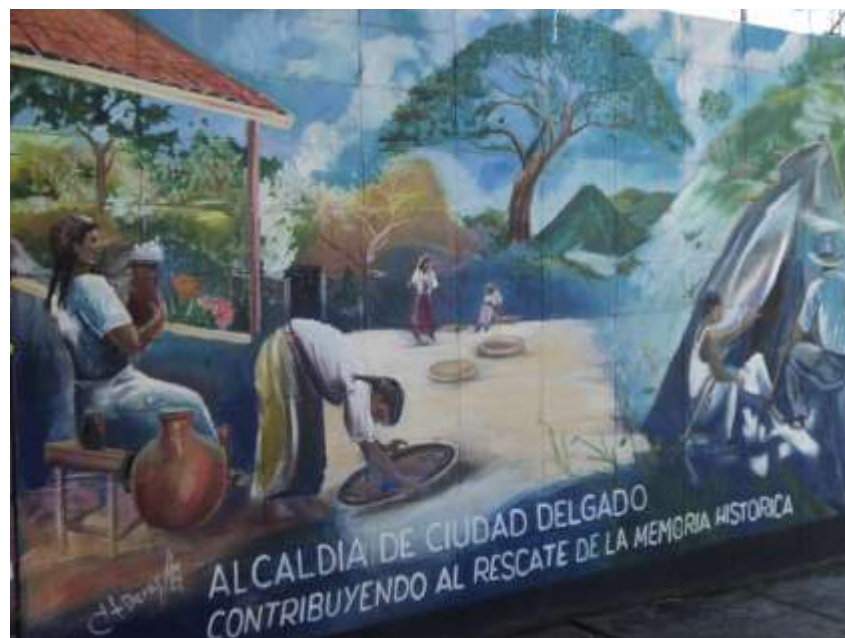
Imagen 29. Mural en pared de escuela Parroquial de Paleca.