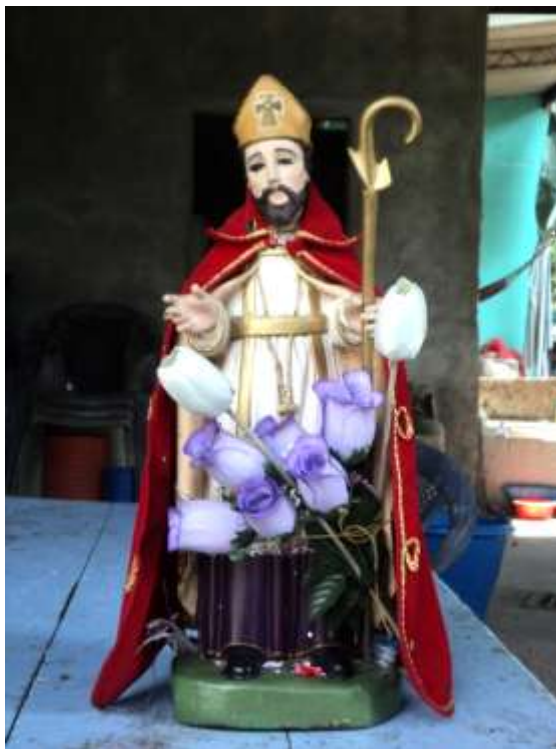
Imagen 40. Imagen de bulto pintada, de San Laureano Obispo. Perteneciente a la mayordomía de Cantón San Laureano. Ciudad Delgado.