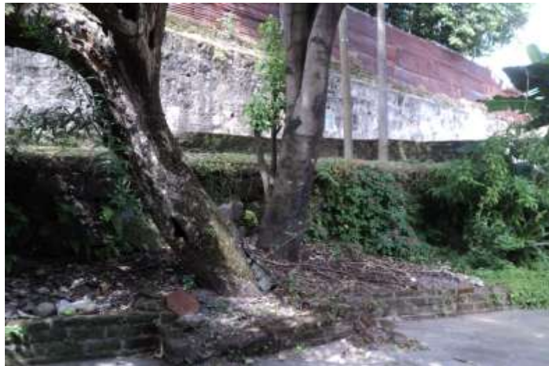
Imagen 5. En la grafica se muestran los restos de los muros posiblemente colonial en el barrio San Sebastián.