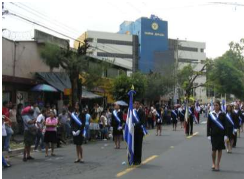
Edificio del centro Judicial de Ciudad Delgado.