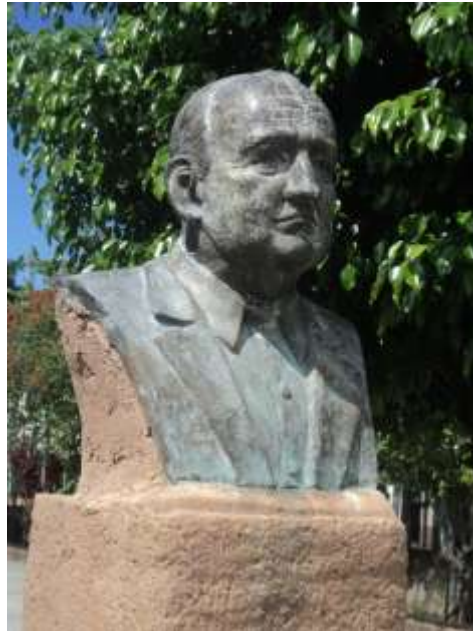
Imagen 10. Escultura elaborada en bronce en honor de Monseñor Esteban Alliet.

Al salir del atrio de la Iglesia de Santiago Aculhuaca, nos encontramos frente de la alcaldía municipal en donde se pueden ver dos placas una que sobresale, pero se dificulta ver por estar tras de una verja alta, esta se encuentra al costado poniente del edificio y está dedicada al ilustre poeta hondureño Don Juan Ramón Molina, y su erección fue en el año 2008, por parte de la municipalidad y la Embajada de la República de Honduras; en el mismo edificio se encuentra empotrada en la pared al lado norte en la puerta de entrada de la Alcaldía una minúscula placa de bronce, colocada por los centros escolares conmemorando la elevación a Ciudad de Villa Delgado, en el año de 1968.