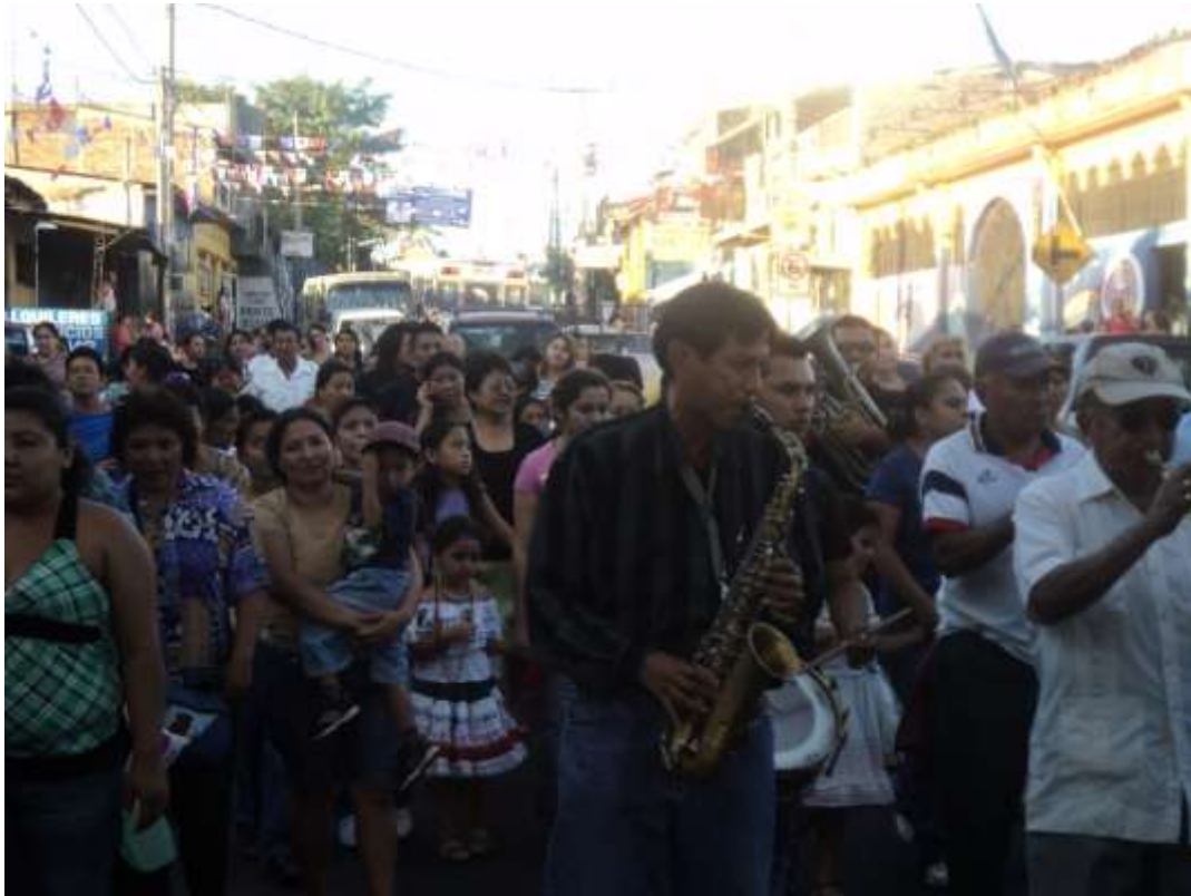
Imagen 53. La banda musical de los Terezones en plena ejecución en la procesión de la Virgen de Guadalupe. 12 de diciembre, a cargo de la mayordomía.