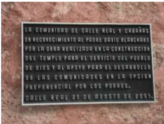
Imagen 20. Placa conmemorativa por la construcción de la iglesia.

Continuemos el recorrido que nos ha llevado a conocer fragmentos de la memoria histórica local, en la que se puede apreciar contornos de algunos de estos recordatorios identitarios en el municipio, que invitan a no olvidar,