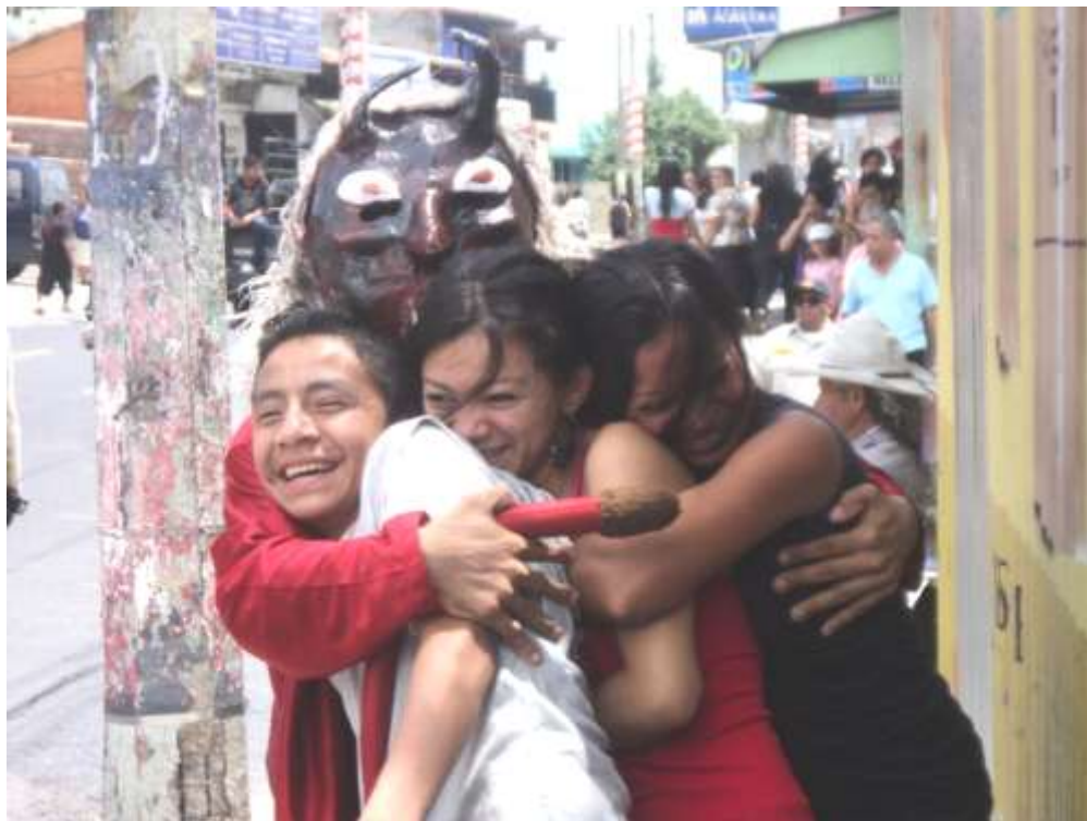
Imagen 52. Viejada en el desfile del correo de las fiestas del municipio.

limosna, en retribución se ejecuta una pieza musical por la banda de música que acompaña la caravana y en ese momento los viejos bailan la pieza musical frente a los ojos de las personas que salen a ver la función que se está ejecutando. La viejada la forman jóvenes de barrio que el mayordomo busca, estos se disfrazan y visten de forma graciosa y usan mascararas, con la introducción de mascararas de plástico fue abandonado casi por completo las mascararas de madera de animales, de viejos y de diablos. Otra variante de esta tradición es la que se realiza por las mayordomías de los cantones como Calle Real y San Laureano en que la viejada sale a avisar que han iniciado las fiestas en estos lugares.