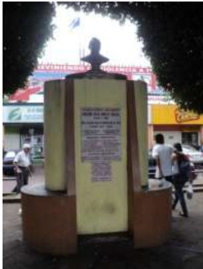
Imagen 13. Escultura conmemorativa a Monseñor Romero.

elíptica, la base sostiene la columna en la que soporta el busto de Monseñor Romero, esta escultura está fabricada de cemento blanco, y pintada con esmalte dorado oscuro lo que da la apariencia de ser una pieza de bronce. La inauguración del monumento se efectuó con participación de la Fundación Monseñor Romero y la Municipalidad en el año de 2006. El monumento de la plaza está rodeado de bancas metálicas que por las mañanas y las tardes es un lugar de descanso para muchas personas que llegan a conversar en el lugar.