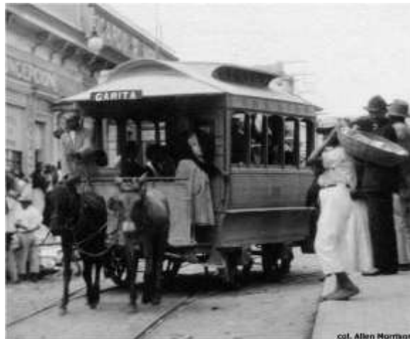
Imagen N° 3. Tranvía tirado por caballos en el centro de San Salvador.