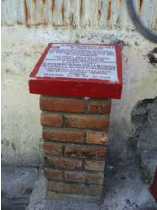
Imagen 23. Placa conmemorativa en el callejón la Joya.