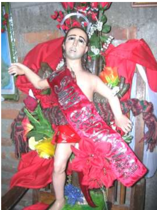
Imagen 39. Imagen de bulto pintada, perteneciente a la mayordomía de San Sebastián. Barrio San Sebastián.