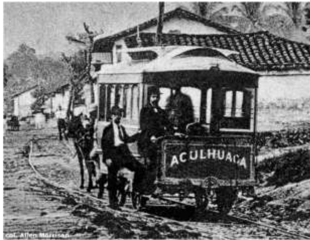
Imagen N°2. Tranvía tirado por caballos que se dirige al pueblo de Aculhuaca.

desde la estación del F. de S.S. y S.T., en la Calle Gerardo Barrios hacia Santa Tecla hasta el año 1929, cuando el ferrocarril fue desmantelado y reemplazado definitivamente por carreteras. La vieja ruta de tranvías y la ruta de ferrocarril están enterradas debajo de la actual carretera Panamericana.