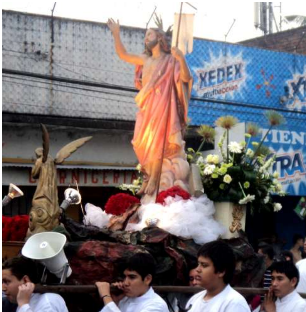
Imagen 37. Imagen de Jesús Resucitado. Talla de bulto, policromada, se encuentra en la iglesia del barrio de Aculhuaca. Vista en Procesión de Domingo de Resurrección.