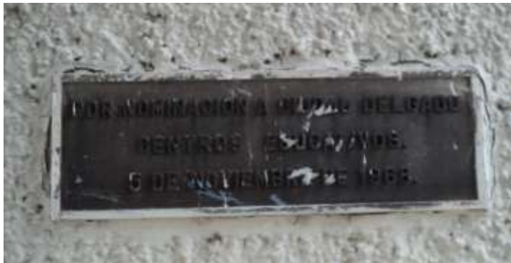
Imagen 12. Placa conmemorativa por nominación a ciudad el municipio.

Pasamos de la alcaldía, caminando hacia el poniente sobre la calle Morazán, y llegamos al mercado municipal, es en este punto en donde se encuentra la pequeña plazuela Monseñor Oscar Arnulfo Romero, allí encontramos una plataforma de concreto, estilizada en dos fases de forma