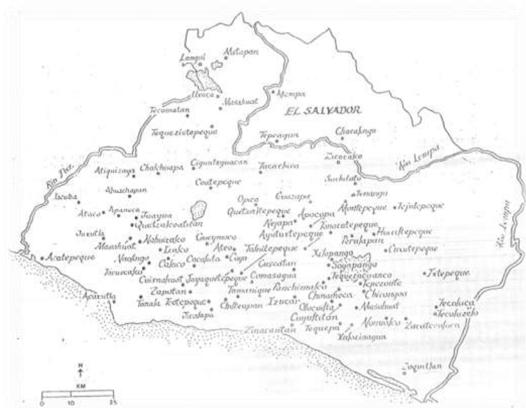
Mapa N° 3. Poblaciones de origen nahuatl en el actual territorio de El Salvador. Fuente: William R. Fowler. Nuevas perspectivas sobre las migraciones de los pipiles y los nicaraos. En el mapa se señalan los asentamientos humanos al inicio de la colonia.

geografía humana cambio a raíz de la conquista, ya que después de esta se desarrollaron mecanismos violentos de centralización de la población, a la que dieron en llamar las reducciones de pueblos de indios, esto consecuentemente les facilitó la introducción de las instituciones económicas, religiosas y jurídicas de la encomienda y el repartimiento que sustentaron el régimen colonial.