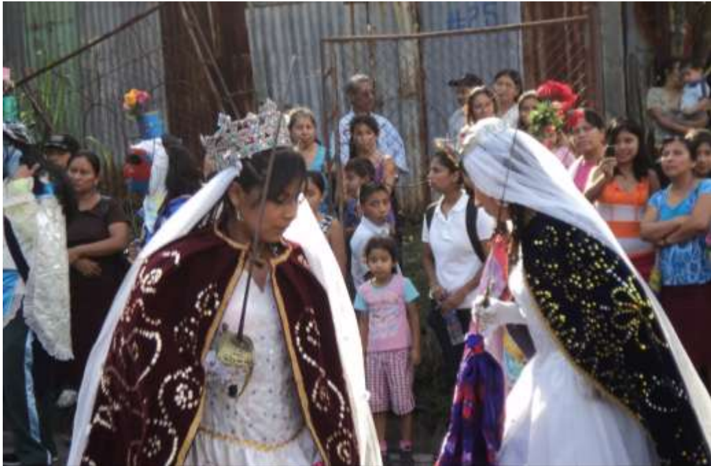
Imagen 51. Escena de danza de moros y cristianos en el Cantón Plan del Pino, procesión de la virgen el Carmen. Los ejecutantes proceden del cantón San José Cortez.