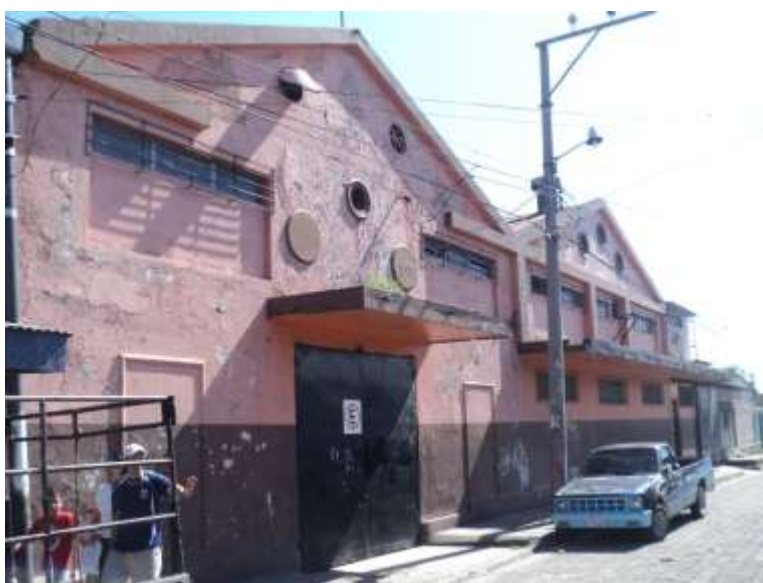
Edificio que ocuparon los cines Hispano y Rex sobre la calle Gloria.