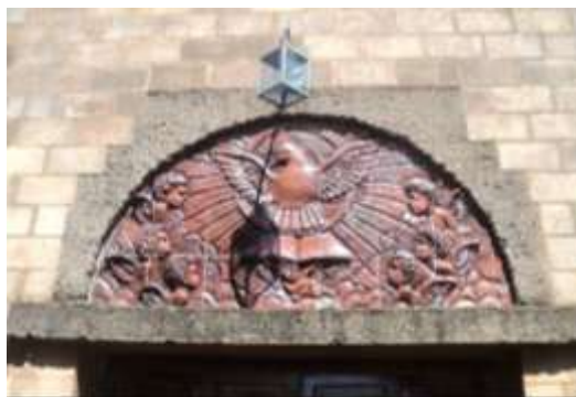
Imagen 21. Uno de los murales que embellecen la ermita de San Laureano. Véase que se ha utilizado la misma técnica que el mural que adorna la Casa de la Cultura de Ciudad Delgado.

pasemos, pues de la Iglesia de Nuestra Señora de Lourdes, al Cantón San Laureano para lo que se viaja por la carretera Troncal del Norte hasta el kilómetro nueve y allí se encuentra el desvío contiguo al cementerio de Calle Real a unos cuatro kilómetros sobre una calle que en su mayoría es de tierra y pasando el río Acelhuate, sobre un puente de casi de diez metros, se llega a la ermita de San Laureano, rodeada de abundante vegetación, le permite a la iglesia un encanto sin igual, al estar en este lugar el visitante se ve obligado seguramente a trasportarse en un viaje interior a buscar tranquilidad, ya que, definitivamente el lugar lo desconecta del trajín de la cotidianidad urbana. La ermita nos muestra en su parte frontal un conjunto de murales con motivos religiosos, fabricados de mosaicos de barro, no se logro conocer la fecha de su elaboración, además en esta ermita se encuentra adornada por ventanales elaborados con técnicas de pintura simulando vitrales.