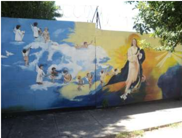
Imagen 28. Escena religiosa en el Barrio Paleca. Pared de la escuela parroquial. Calle las Ánimas.