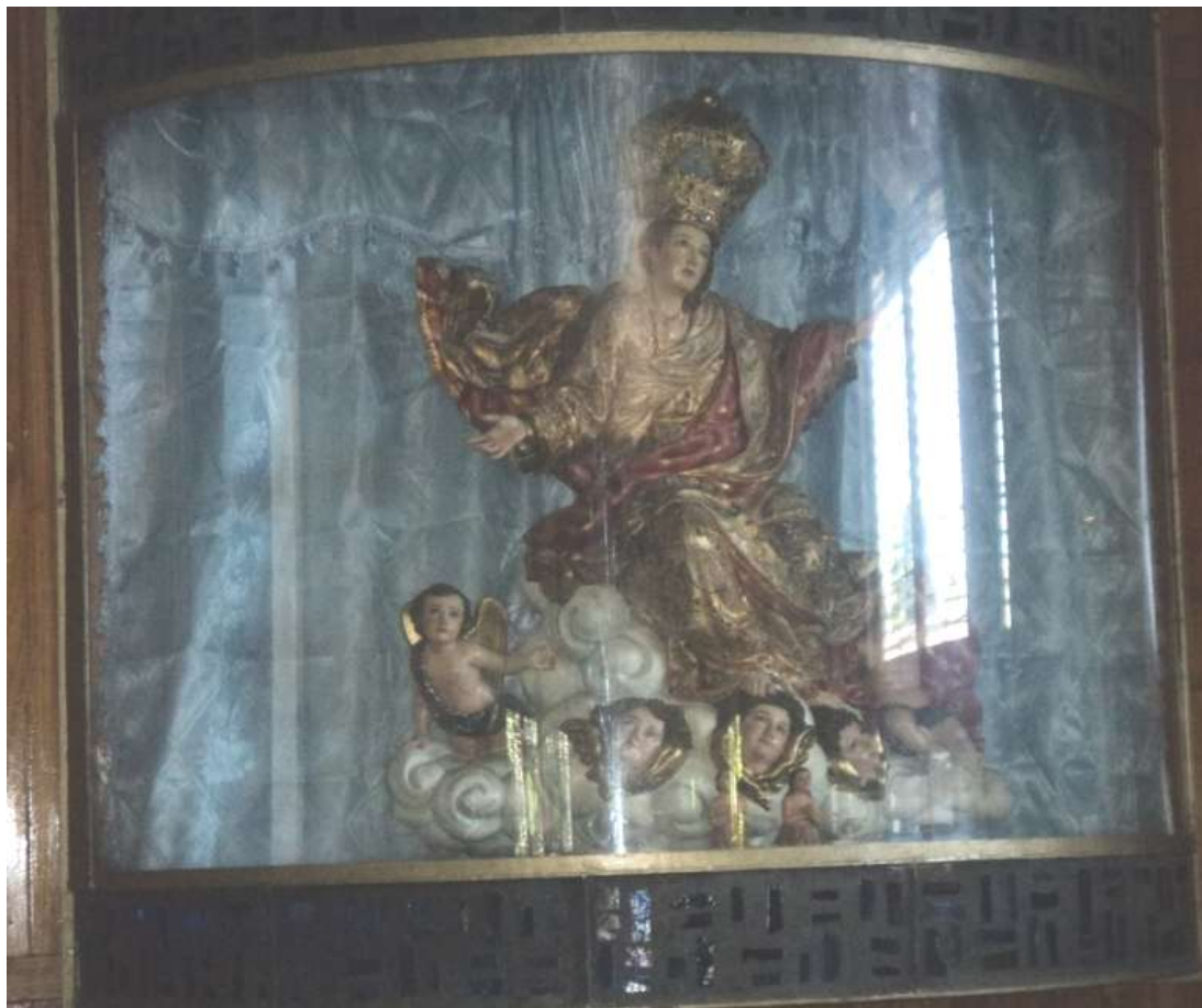
Imagen 31. Imagen de Nuestra Señora de la Asunción, talla de bulto, policromada, se encuentra en la iglesia del barrio de Paleca. A sus pies entre los querubines se pueden observar dos pequeñas imágenes, en el centro, correspondientes a las ánimas vendidas del purgatorio, que no son parte de la imagen principal. Véase que la imagen está en posesión sentada sobre las nubes que sostienen los querubines. Su cabeza sostiene una hermosa corona que según la versión popular fue entronada en catedral, junto a otras imágenes de la misma advocación.