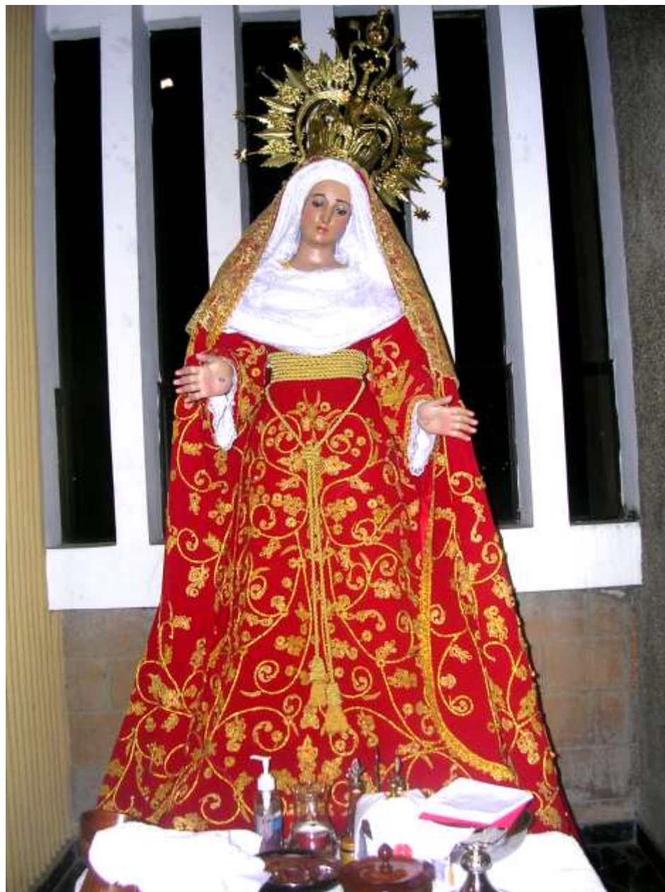
Imagen 33. Imagen de La Dolorosa, madera tallada policromada, se encuentra en la iglesia del barrio de Aculhuaca. Obsérvese la riqueza en la vestimenta de la imagen, costuras de hilo de oro, diseños de helechos y flores en el vestido; suntuosa corona con resplandor y estrellas. Nótese los estigmas en las manos de la imagen y las lagrimas, a sus pies los ornamentos utilizados en la misa.