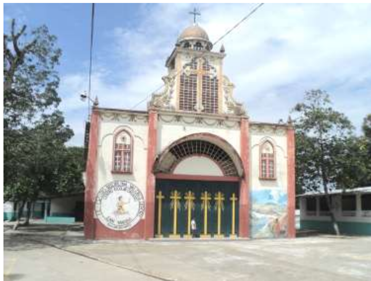
Iglesia del Cantón San José Cortez.

Arquitectura del municipio de Ciudad Delgado.