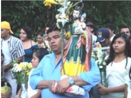
Imagen 41. Imagen San José de bulto pintada. Perteneciente a la Mayordomía del Cantón San José Cortez. Ciudad Delgado.