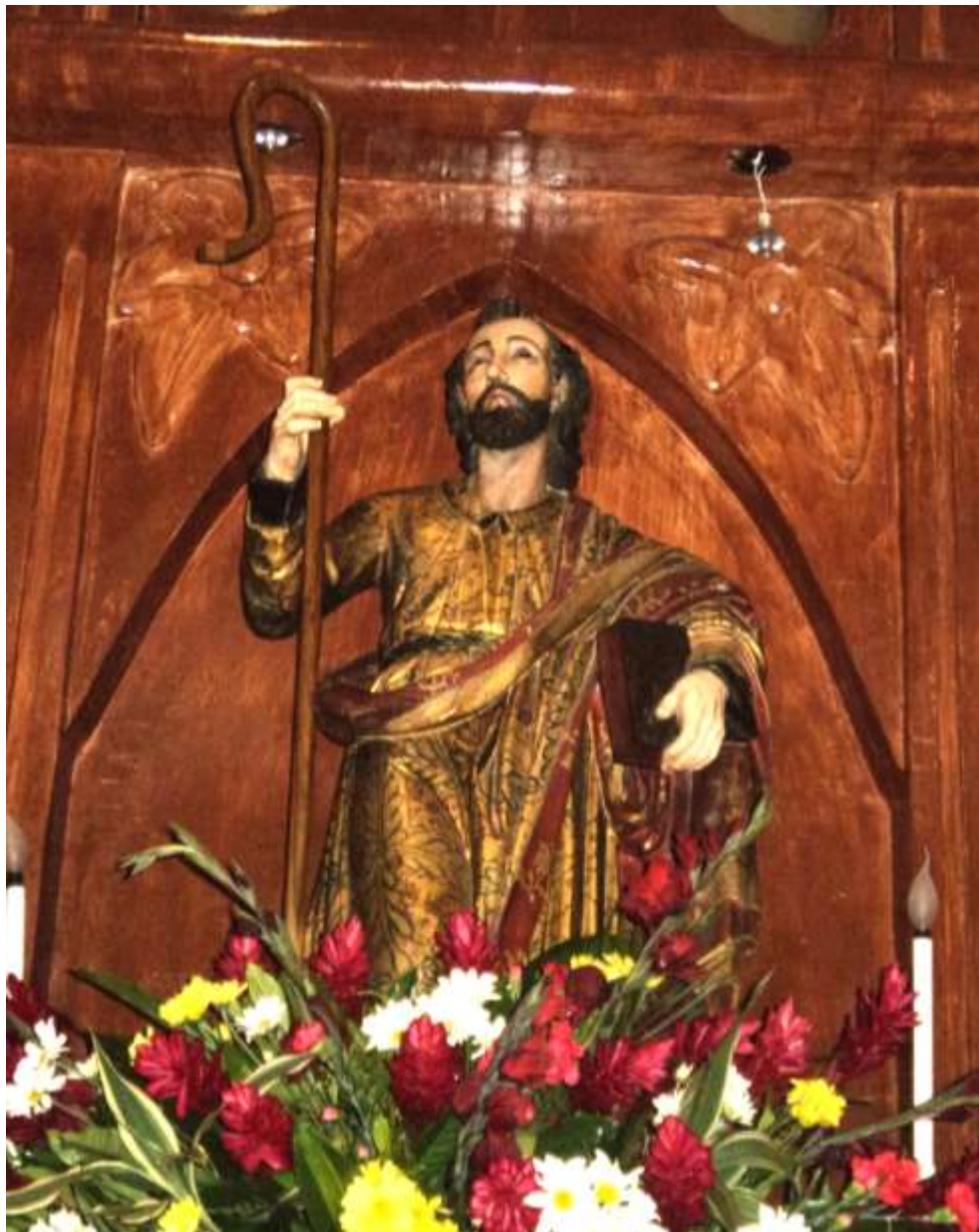
Imagen 32. Imagen de Santiago Apóstol, talla de bulto, policromada, se encuentra en la iglesia del barrio de Aculhuaca. Véase el movimiento que denota la postura de la imagen del apóstol en marcha, bajo su brazo derecho carga los evangelios y el izquierdo el báculo.