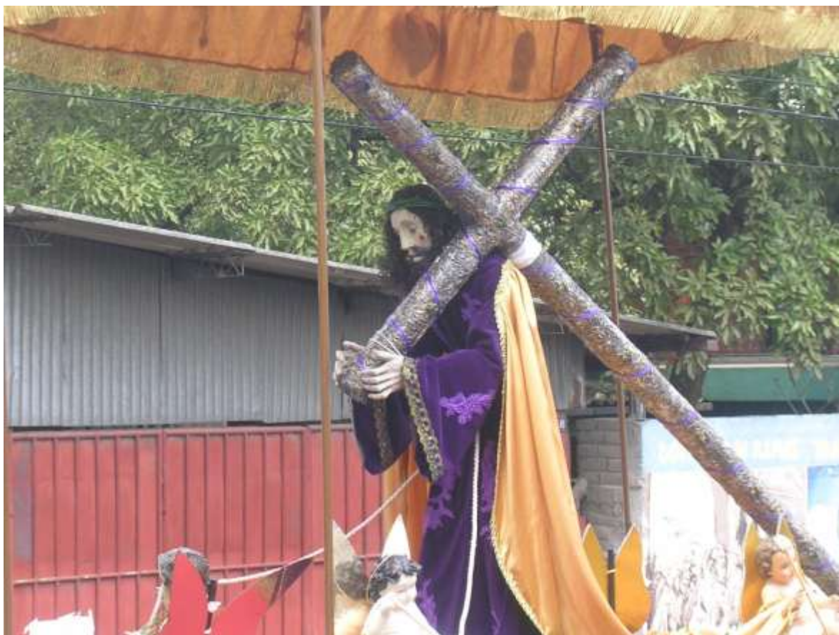
Imagen 36. Imagen del Nazareno, Imágenes de vestir, policromada, se encuentra en la iglesia del barrio de Paleca. Vía Crucis Viernes Santo. Nótese la cruz forjada en hoja de plata, repujada con detalles exquisitos de hojas y helechos, sin duda a esto se referían los arzobispos cuando se referían a los ornamentos de plata en las iglesias. Obsérvese las imágenes de los ángeles (imágenes de Niño Dios a las que se les pone alas).