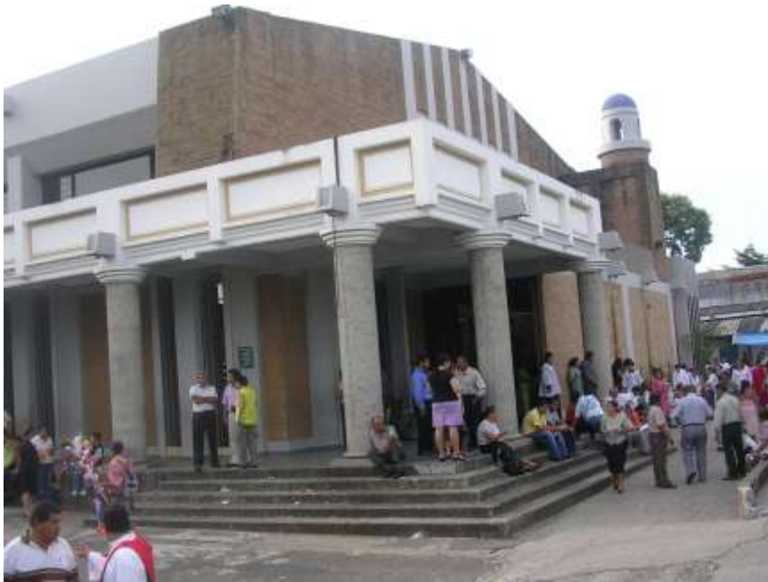
Imagen 7. Iglesia de Santiago Aculhuaca.