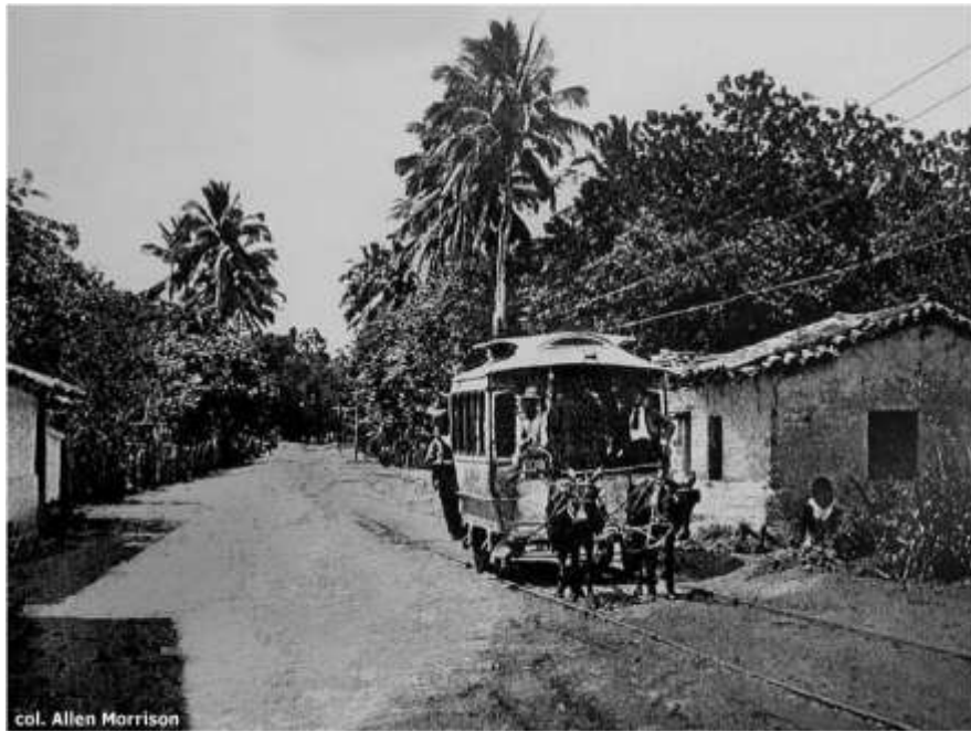
Imagen N°4. La fotografía señala el tramo entre la “Garita” en el barrio Cisneros y el pueblo de Aculhuaca, hoy Ciudad Delgado. Fuente: Allen Morrison. Los tranvías de El Salvador. Pág. Web. Julio Castro. Estampas del viejo San Salvador.