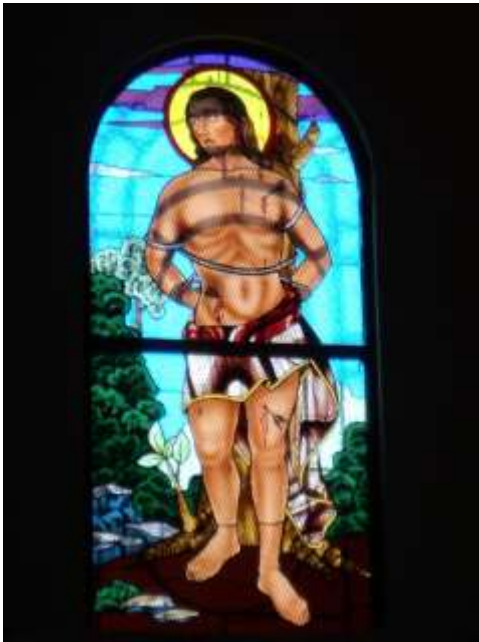
Imagen 24. Uno de los Vitrales que se encuentran en la Iglesia de San Sebastián.

por suerte no ha sido robada y no ha ido a parar a las chatarreras, contiene la fecha de construcción de dicho centro escolar.