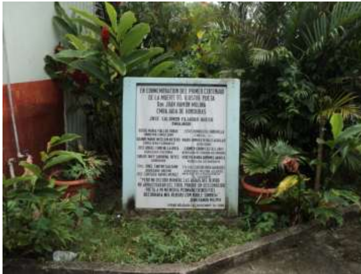
Imagen 11. Placa Conmemorativa al poeta Juan Ramón Montalvo.