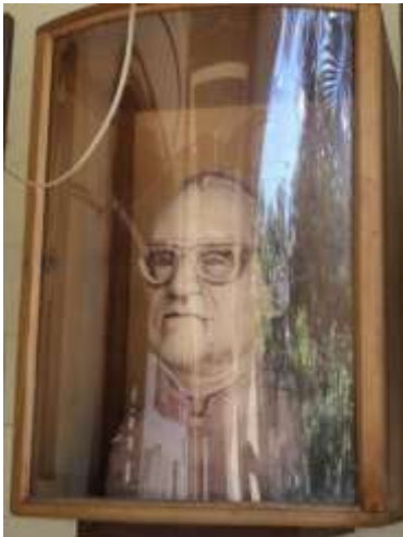
Imagen 16. Busto de Monseñor Romero. Iglesia Asunción Paleca.

Sobre la calle las Animas y al llegar a la iglesia de Nuestra Señora de Asunción de Paleca en la entrada al poniente se encuentra un busto de Monseñor Romero, el cual está esculpido en cemento blanco y pintado con barniz blanco, en la misma iglesia encontramos también la placa en mármol verde, en conmemoración de la construcción del templo y la consagración del mismo, bajo administración parroquial del Pbro. Gregorio de J. Landaverde.