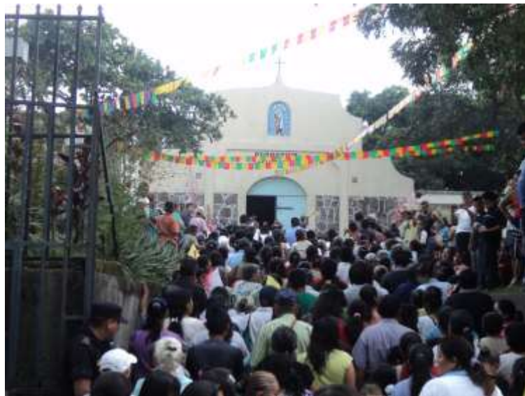
Iglesia del Cantón Plan del Pino.