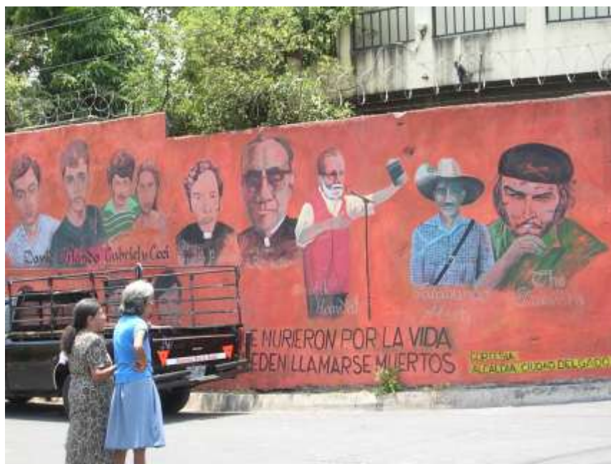
Imagen 27. Mural del Barrio San Sebastián. Muestra mártires del barrio y figuras políticas de la izquierda. Sobre la calle Colón (antiguamente llamada calle la Ronda).