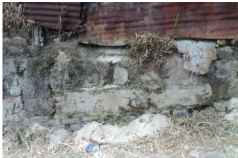
Imagen 6. Muro de contención en el barrio San Sebastián, fabricado en base la técnica de cal y canto.

De la arquitectura que se observa en el municipio, la de mayor datación la componen las construcciones de bajareque recubierta de lámina o repello de