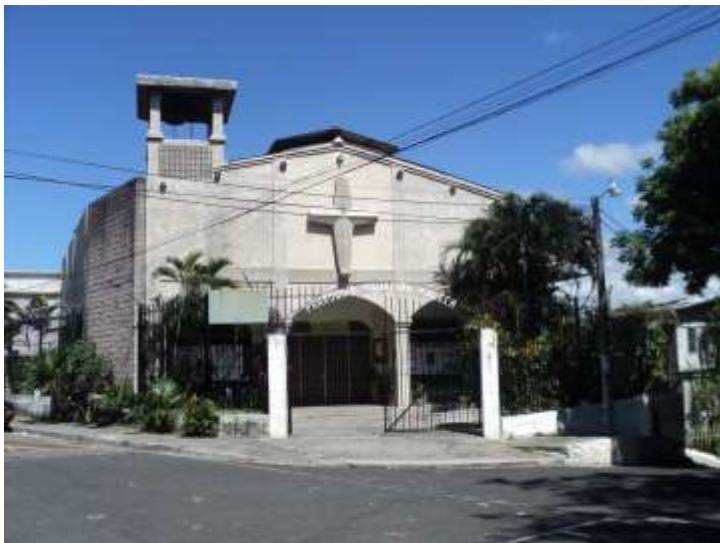
Imagen 8. Iglesia de Nuestra Señora de Asunción Paleca.