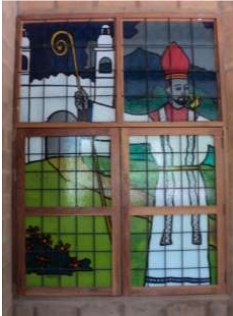
Imagen 22. Uno de los ventanales pintado con técnica de vitrales en la ermita de San Laureano.

Desde este hermoso paraje del municipio retornamos nuevamente a la cabecera del municipio, allí recorreremos la Avenida Juan Bertis y llegamos a el callejón la Joya, en esta intercepción en diciembre del 2010 la directiva municipal del FMLN (partido político) coloco una placa de mármol en conmemoración a los combatientes caídos en combate en el marco de la ofensiva militar del 11 noviembre 1989. La placa esta sobre un pedestal de ladrillo de barro y el lugar donde se coloco dificulta la visibilidad monolito.