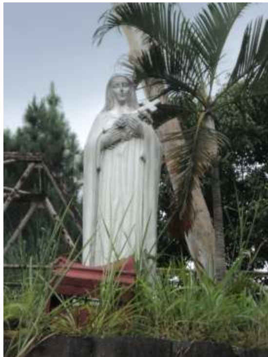
Imagen 19. Escultura religiosa en la iglesia de Calle Real. Se puede observar desde la Troncal del Norte.