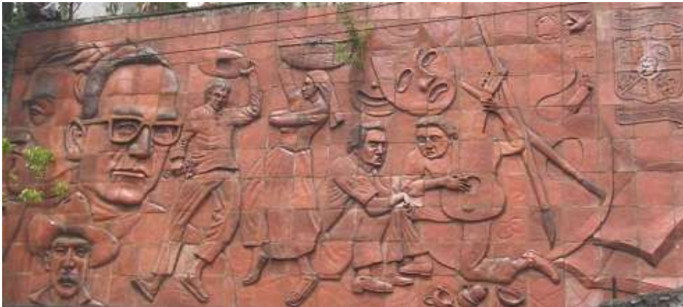
Imagen 14. Mural en alto relieve fabricado de barro cocido en la casa de la Cultura de Ciudad Delgado. Véase que sobresale el rostro de Monseñor Romero.

de 10 por 5 metros de diámetro, su contenido es ecléctico, muy vistoso por sus elementos costumbristas, la casa de la cultura no cuenta con registro de la fecha de que se termino de colocar el mural.