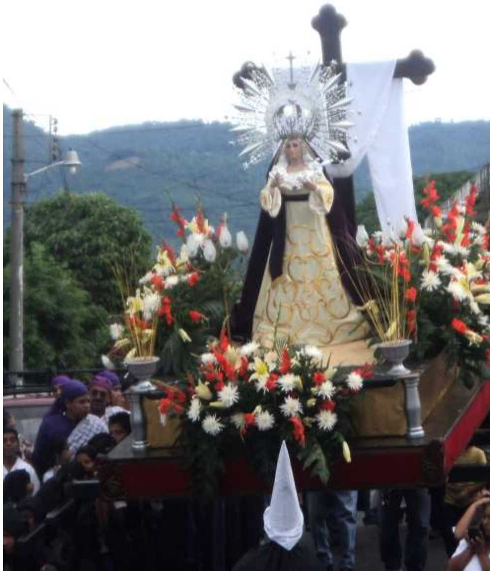
Imagen 38. Imagen de la Dolorosa, madera tallada policromada, se encuentra en la iglesia del barrio San Sebastián. Procesoión de las Hermandades en honor a la Dolorosa en el barrio San Sebastián.