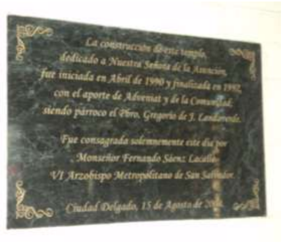
Imagen 17. Placa de conmemoración de la construcción de la parroquia y consagración.

De la iglesia Asunción de Paleca partimos al cantón Calle Real, viajamos por la carretera Troncal del Norte y precisamente llegamos a la iglesia de Nuestra señora de Lourdes en la que encontramos un busto de Monseñor Romero esculpido en barro, esto es interesante ya que recuerda lo importante