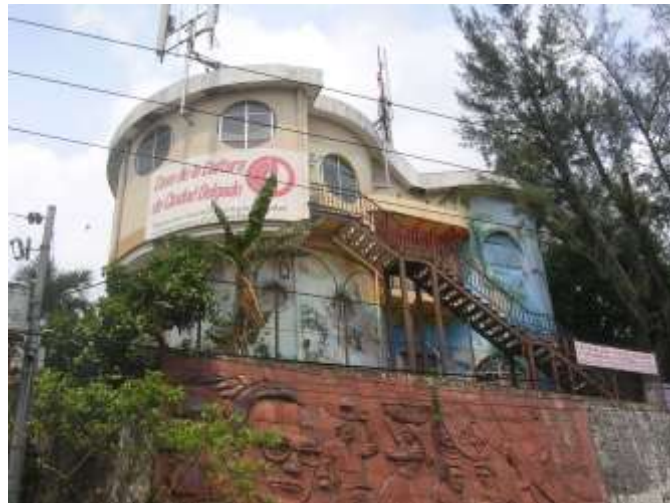
Casa de la Cultura de Ciudad Delgado.