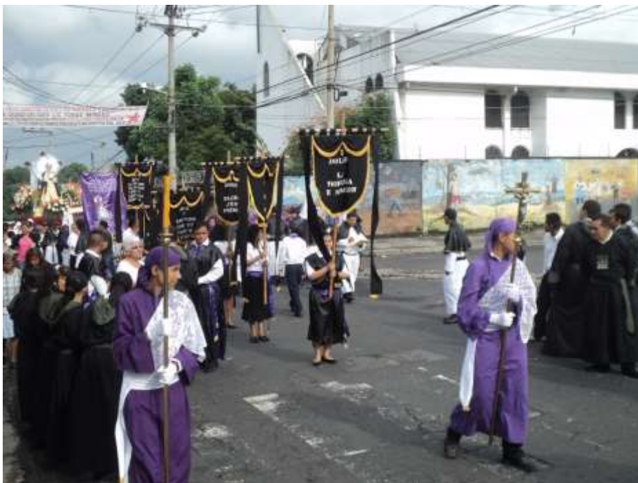
Imagen 45. Procesión de hermandades en el barrio San Sebastián.

Entre las funciones que desempeñan los miembros de las hermandades son: reuniones periódicas en la parroquia, planificar actividades religiosas, dirigir pasos procedimentales, revisar ruta de peregrinación, pedir limosna al iniciar la cuaresma entre los fieles de cada barrio y durante las procesiones, para sufragar gastos de la semana como la música, regular el tránsito de vehículos durante los pasos procesionales, cargar las urnas, diseñar y decorar las urnas o andas procesionales, encabezar las procesiones, vestir imágenes, cuidar los ornamentos, compra de pólvora, entre otras actividades.