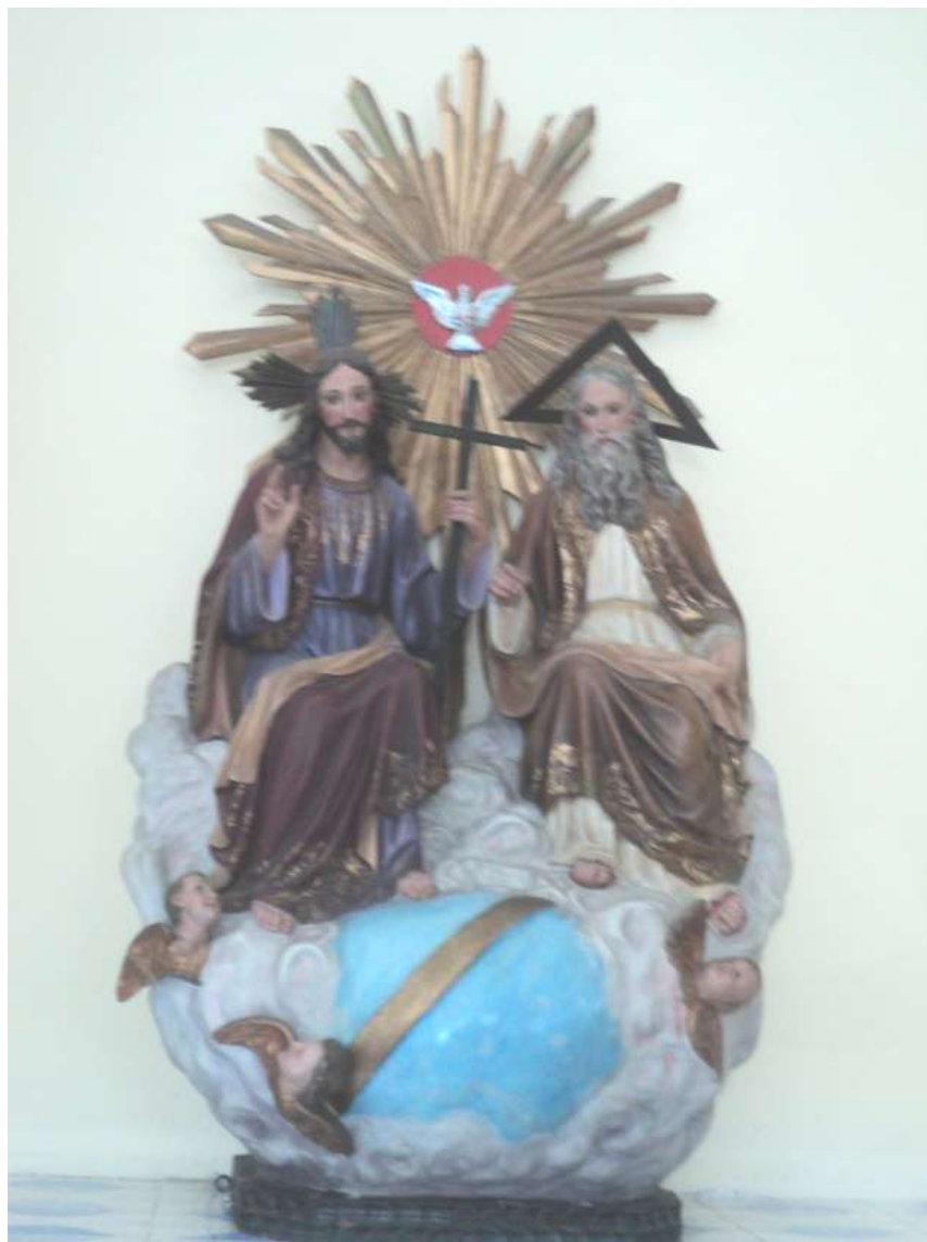
Imagen 35. Imagen de la Divina Providencia, talla de bulto, policromada, restaurada, se encuentra en la iglesia del barrio San Sebastián.