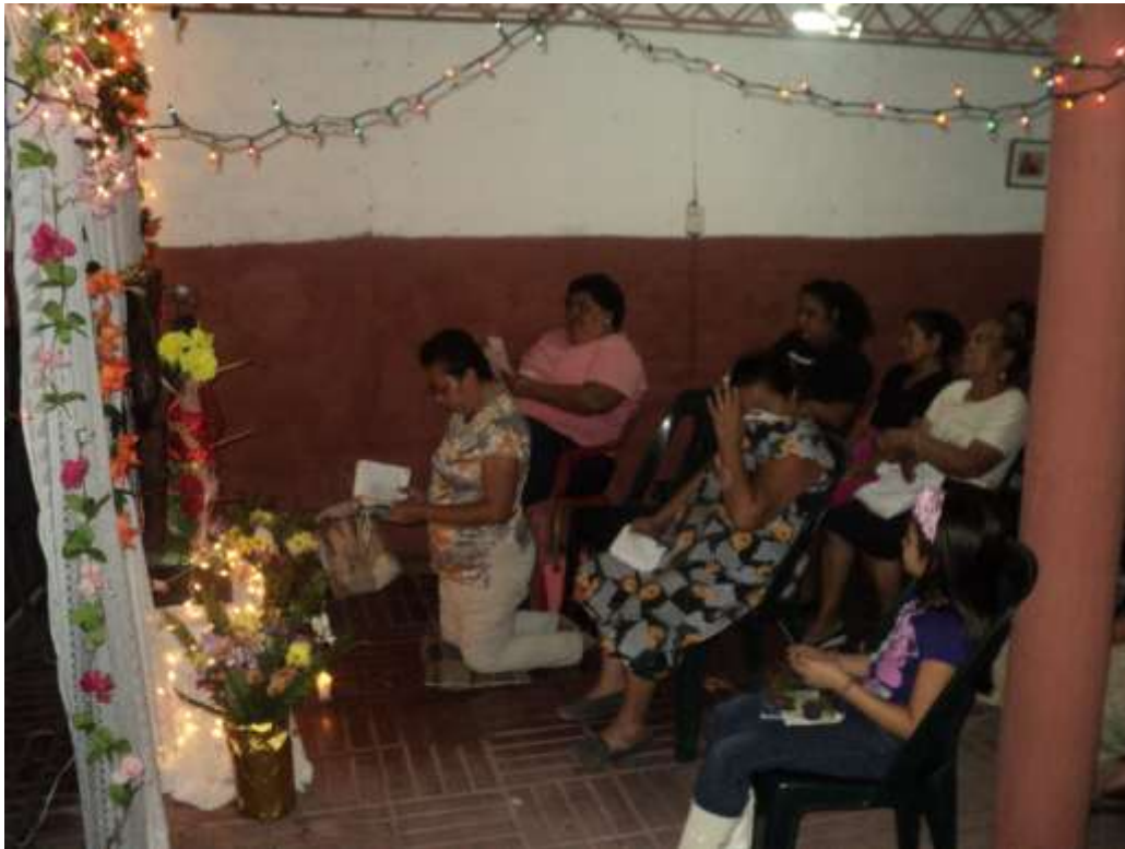
Imagen 47. Rezo en casa de capitana en el barrio San Sebastián.