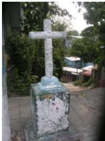
Imagen 15. Cruz del Calvario del barrio Paleca.

desapercibida. La ubicación de la cruz por hoy está en la calle principal del barrio, a sus espaldas se encuentra el acceso a la calle la Ronda, con este nombre era costumbre designar las calles que marcaban el límite de los pueblos, suerte que en Paleca se conserve el nombre de esta calle ya que permite darnos una idea como ha ido expandiendo la población alrededor de lo que fue el centro del extinto pueblo, hoy barrio de Ciudad Delgado. La Cruz del Calvario como le dicen, es de cemento, se llegue sobre un pedestal con una base que se eleva de la acera unos 10 centímetros, la cruz simula estar hecha de dos troncos en la cual se encuentra una enredadera de uvas, que tiene frutos y hojas extendidas. No se encontró registro de la construcción, sin embargo al consultar con las personas mayores del barrio manifestaron que desde su infancia la cruz esta en ese lugar.