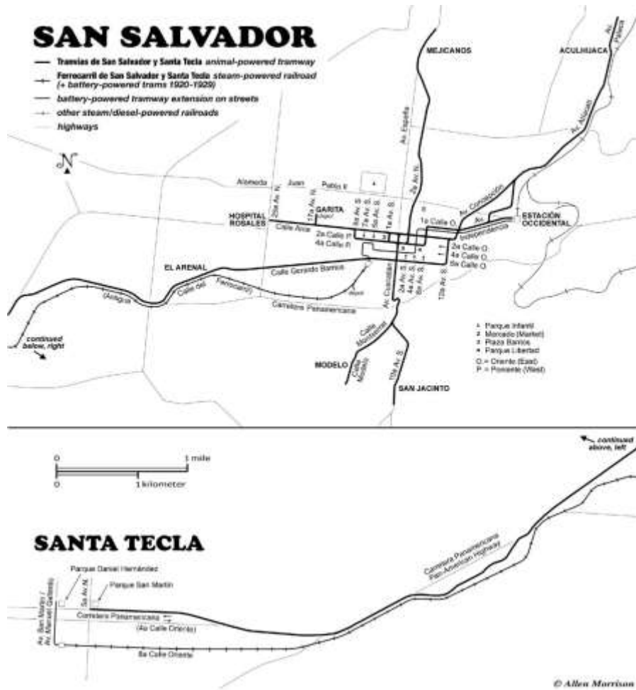
Mapa N°5. Recorrido del tranvía de San Salvador. Ramal del tranvía que conduce al pueblo de Santiago Aculhuaca. Hoy barrio de Ciudad Delgado.

En 1925, La ciudad de San Salvador inicia un programa de pavimentación de calles que simplemente destruyó las líneas de tranvías. El último tranvía tirado por caballos se cree que transitó ese mismo año en San Salvador, sin embargo fue hasta 20 de octubre de 1947 que el tranvía tirado por caballos, que prestaba sus servicios en Izalco, fue clausurado al pavimentarse también la calle (Baratta: S/F). Los tranvías de baterías continuaron transitando