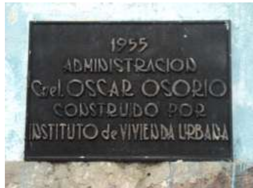
Imagen 25. Placa que se encuentra a la entrada del Centro Escolar Juana López.

Para finalizar este viaje a los sitios del municipio que guardan parte de la memoria histórica local y que enlazan a grupos de personas con sentimientos o ideales comunes, y que permiten manifestarse culturalmente por medios de ellos, señalándolos con modestos monumentos. En la historia de El Salvador se han suscitado dos eventos de especial trascendencia para la historia moderna que la historiografía registra, se tratan de las batallas libradas en las faldas del Cerro Milingo (formado por las voces náhuat: mil , cultivo, sementera; in ,