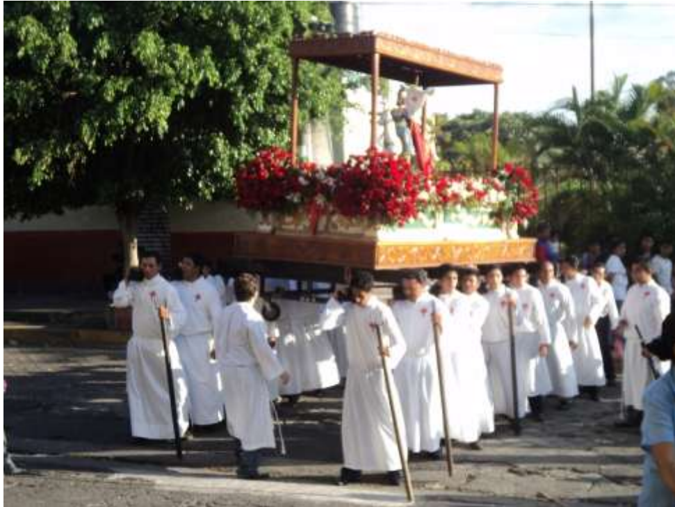
Imagen 46. Procesión del Patrón Santiago. Barrio Santiago Aculhuaca.