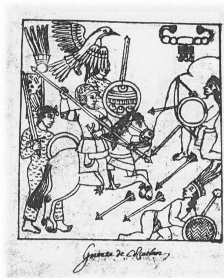
Imagen N°1. Grabado de la batalla de Cuscatlán. Fuente: Escalante Arce, Pedro. Los Tlaxcaltecas en Centro América. La lámina representa la batalla de Cozcatlan (Cuzcatlán). Reproducción del código Tlaxcala.

(1987), reconstruye hipotéticamente la organización del espacio en la época prehispánica y nos dice que: templos y edificios públicos cercados por una muralla formaban el núcleo; alrededor de éste, una concentración de ranchos irregularmente distribuidos, y alrededor de éstos, repartida por el bosque, una dispersión de cabañas más humildes, ya aisladas o ya agrupadas en pequeñas aldeas, cerca de los campos de la milpa, que sus habitantes habían limpiado.