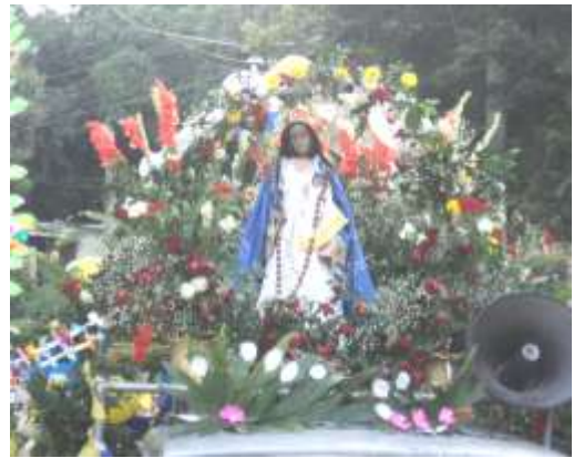
Imagen 43. Imagen de la virgen del Rosario. Imágenes de vestir, policromada, se encuentra en la iglesia del Cantón Plan del Pino. Ciudad Delgado.