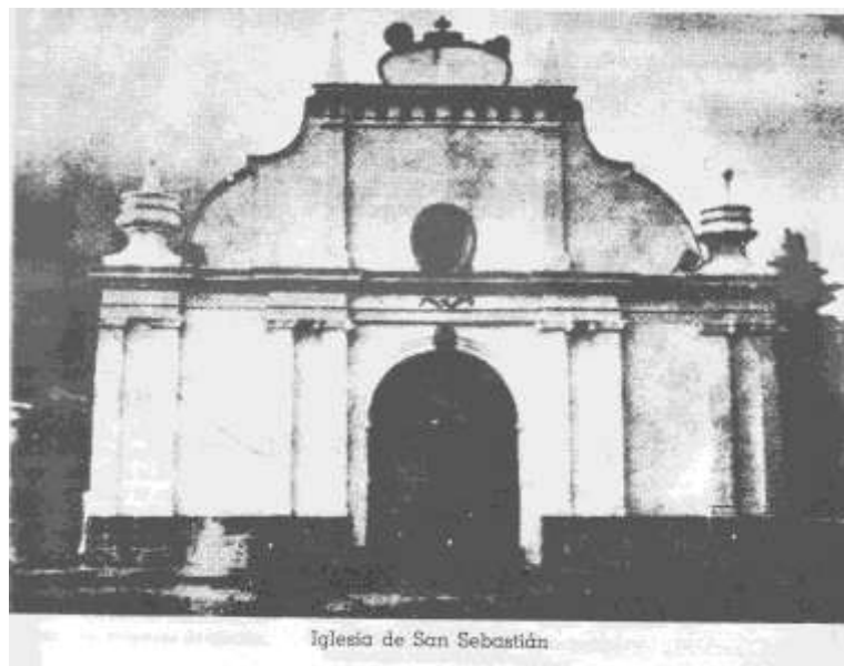
Imagen 30. Fachada de la antigua iglesia de San Sebastián. Ciudad Delgado.

En la calle el sol es abrasador. Con la hospitalidad tradicional del país, nos convidan, y no es de buen tono reusar...”