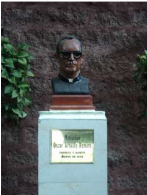
Imagen 18. Escultura de Monseñor Romero en Cantón Calle Real.