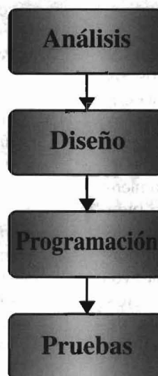
Figura 1. El modelo de desarrollo en cascada

La figura 1 muestra un esquema simplificado de este modelo. Para los no versados en Ingeniería del Software, diremos que el análisis (más propiamente, "análisis de requerimientos") es una descripción de lo que debe hacer el sistema, el diseño son los "planos" del sistema y la programación es el proceso de construir el sistema acabado. Una vez realizada la programación, es necesario probar el programa para detectar los posibles errores y corregibles, etapa que se denomina con el nombre de "Pruebas".