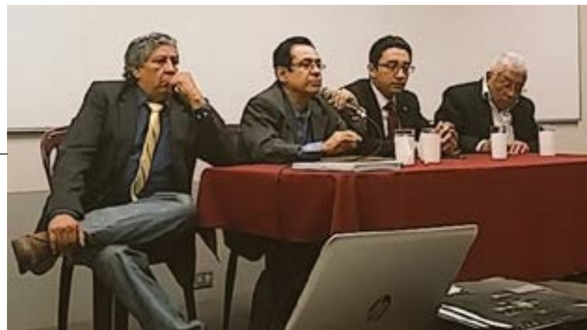
EN UTEC. Alumnos y expositores interpretaron la información que el "Libro Azul" presenta desde hace 100 años.