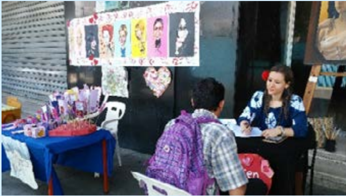
Se hicieron versos para celebrar el Día Internacional de la Mujer.