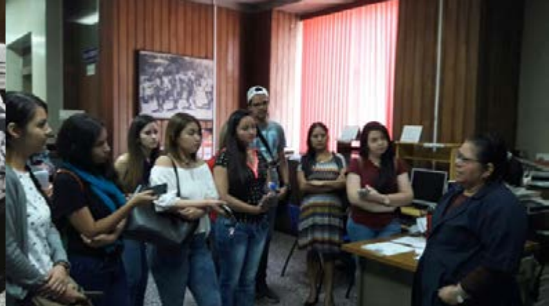
Estudiantes universitarios reciben información en la Sala de Informática de la BINAES.