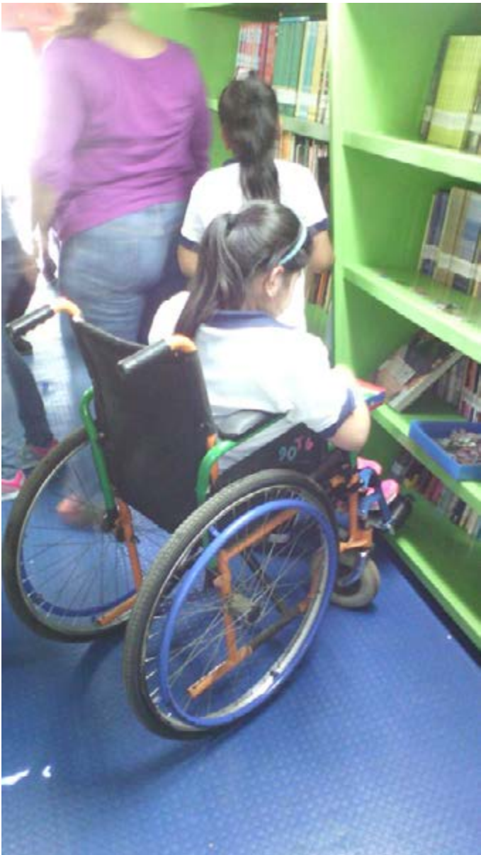
No hay barreras para ingresar al Bibliobús, tal cual lo muestra una alumna del Centro Escolar Caserío Ciudad Romero del cantón Zamorano, Usulután.