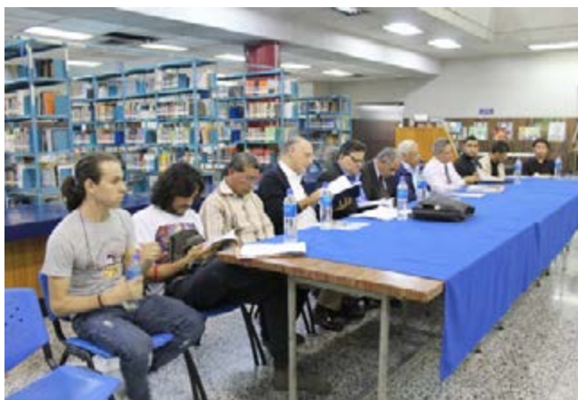
Doce poetas participaron en el recital denominado “El Salvador un poema de amor”.