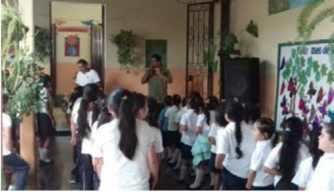
Momentos alegres con las niñas del Centro Escolar “Ana Dolores Arias”, ubicada en el municipio de Suchitoto, Cuscatlán.