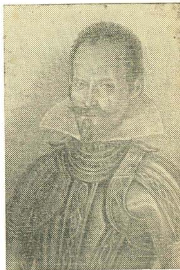
PEDRO DE ALVARADO,