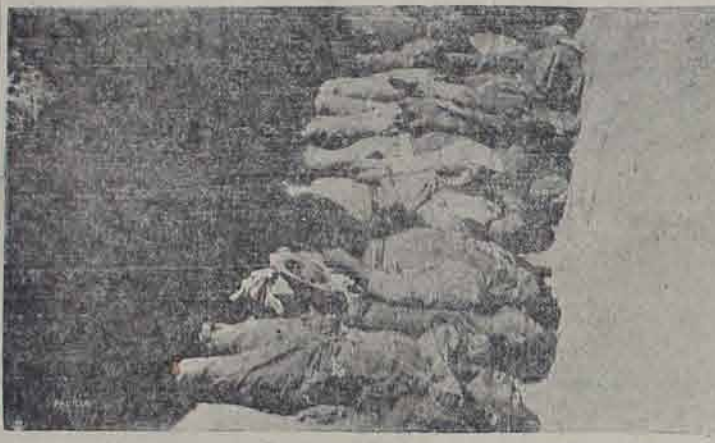
Grandes ranjas se abren para enterrar los cadáveres. En la presente fotografía puede verse una gran cantidad de cadáveres, colocados en la gran cavidad, que les servirá de sepultura. Entre estos numerosos muertos se encuentran algunos rumanos y checoslovacos que figuraban como cabeceles del frustrado movimiento.