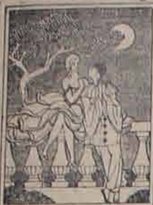
PARFUM TENDRE RIGAUD 16, Rue de la Paix, PARIS

San Francisco, Departamento de Moctezuma, enero de 1932. Antes de todo, quiero advertir al lector, que lo que a continuación voy a informar en la presente crónica, no lleva otro nombre ni más que la verdad, por constarme de vista y oído, como le consta al público de esta ciudad, quien no me dejará mentir, es lo que no estoy acostumbrado.