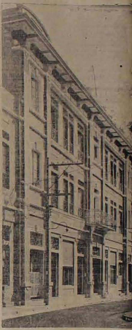
Palacio de cemento armado monolítico asísmico e incombustible, propiedad de la señora doña Leonor de Quiñonez. Este edificio de tres pisos, es parte del Hotel Nuevo Mundo. La armonía de sus líneas arquitectónicas modernas, constituye un éxito artístico y uno de los mejores adornos de la Capital. Es obra original del Arquitecto don Alberto Ferracuti.