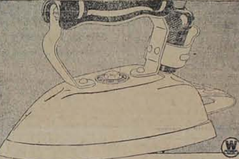
La plancha que piensa por sí misma!

Es obra original del Arquitecto don Alberto Ferracuti.