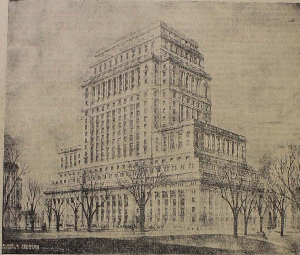
DOMICILIO SOCIAL: MONTREAL