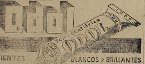
DIENTES BLANCOS Y BRILLANTES