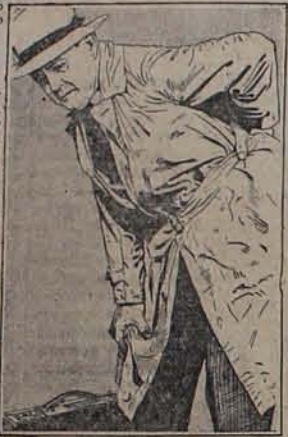
ayudar mis ocupaciones. Hoy estoy enteramente libre de dolores.

"Yo sufría dolores de los riñones y la vejiga. Estos empeoraron tanto, que me obligaron a dejar de trabajar. No obstante el mayor alivio, hasta que recibí una muestra de Píldoras De Witt, no obstante haber usado anteriormente toda clase de remedios. El uso de una muestra de dichas píldoras me proporcionó alivio, y después de tomar dos frascos, pude reanudar mis ocupaciones. Hoy estoy enteramente libre de dolores."