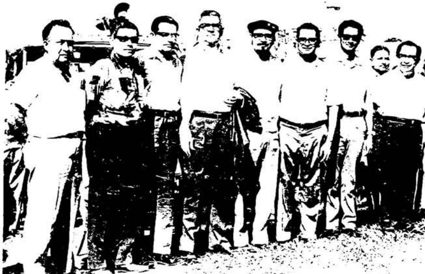
COMISION DE DEPORTES