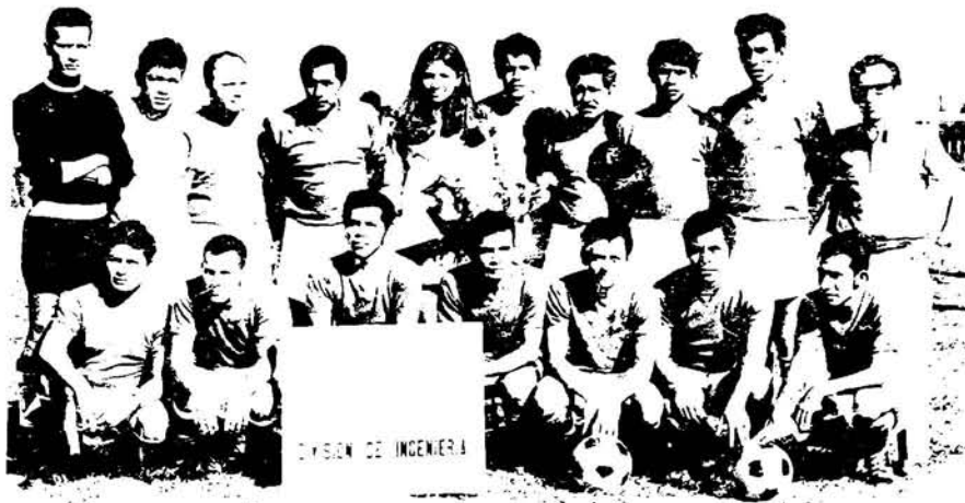
DIVISION DE INGENIERIA