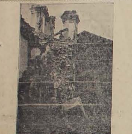
El campanario de otra de las iglesias de Zacatecoluca desplomado desde gran altura.

MAS DERRUMBES Seguimos adelante, pues teníamos que llegar a Zacatecoluca antes del medio día, para tener tiempo suficiente de distribuir el pan Victorias a los damnificados, ya que allí era más crecido el número de víctimas. Mientras nuestro automóvil, de veintidós kilómetros, nos dábamos cuenta de que, a uno y otro lado de la vía, aumentaba el número de derrumbes, todos de consideración.