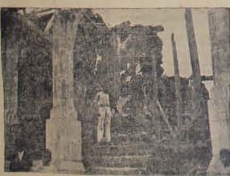
El Palacio Municipal de la ciudad de Zacatecoluca totalmente destruido por el violento sismo de la madrugada de ayer. Este edificio tendrá que ser acabado de demoler para ser construido de nuevo pues es casi nada lo que de él queda en pie.