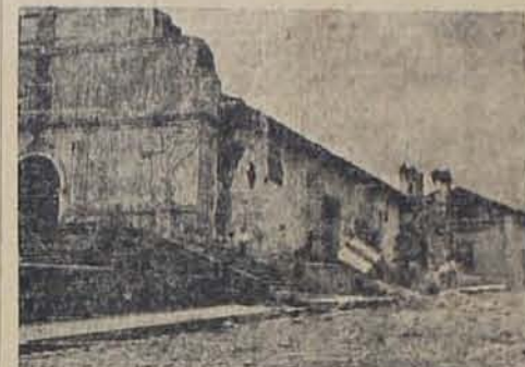
Esta fotografía demuestra la enorme violencia del terremoto. Una parte de la fachada de la iglesia de El Carmen volada a más de quince metros de distancia. La iglesia está totalmente dañada. — (Fotografiado Padilla).

Brillante Labor De Don Virgilio Crisonino, Fotógrafo Colaborador De DIARIO LATINO.—Fotografías Exclusivas Para Este Periódico