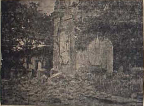
Aspecto de los destrozos causados en la iglesia parroquial de Zacatecoluca. Las torres se visieron al suelo.