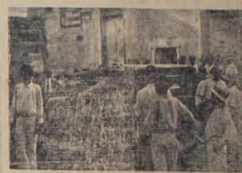
El Coronel Trabanco hablando con un reportero de DIARIO LATINO frente a: Teatro Principal donde se están guardando a los numerosos heridos de la catástrofe.