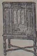
Modelo RAE-25 ¡¡El Golpe Maestro de la RCA-Victor!!

Un radio Superexcelente por su precio módico.—La expresión más grande en un circuito de 10 tubos.—Volúmenes potencia, claridad alcance, selectividad! Incorpora los más sensacionales adelantos en el radio. ¡Un modelo de lujo en una elegante consola suntuosa, contruida para las que también se obtiene lo mejor!