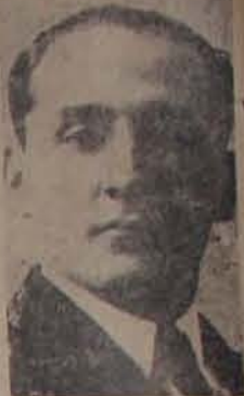
Haya de la Torre

La bandera blanca. Tres señalamientos militares que volaron sobre dicho crucero, dejaron caer una bomba, a la que contestaron los sublevados disparando un cañonazo contra tierra, en cuyo momento se informó bien pronto en el edificio de la Escuela Naval.