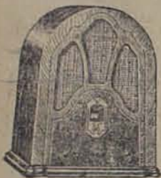
Modelo R-4 Superheterodino de 7 tubos equipados con tubo pentodo.

En cada radio RCA-Victor comprobará Ud. los 10 puntos del sistema RCA-Victor de Tono Sincronizado!!