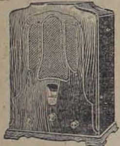
Modelo R-5 Superheterodino de 8 tubos equipado con el Control Automático de Volumen y Pentodo.