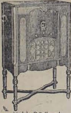
Modelo R-6 Consola Superheterodino de 7 tubos equipado con Pentodo y con el Micro-Tono Control.

Compruebe usted mismo los 10 puntos del Sistema de Tono Sincronizado, sin el cual ningún radio puede tener éxito hoy día!!