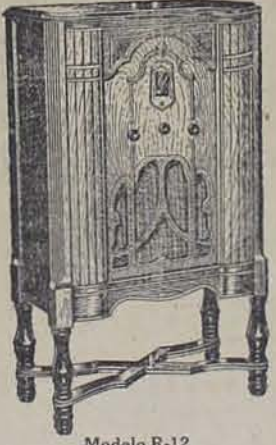
Modelo R-12 CONSOLA Superheterodino de 8 tubos, equipado con el Control Automático de Volumen y Pentodo.