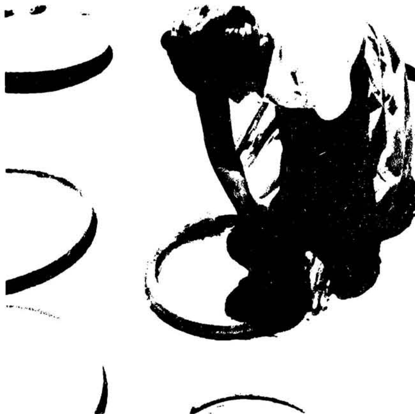
Hay que reflexionar sobre el estímulo a las expresiones populares, sin deformar los valores de la tradición.