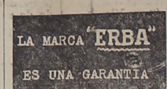
LA MARCA "ERBA" ES UNA GARANTIA

Se hacen viajes especiales a toda hora atendidos al momento.