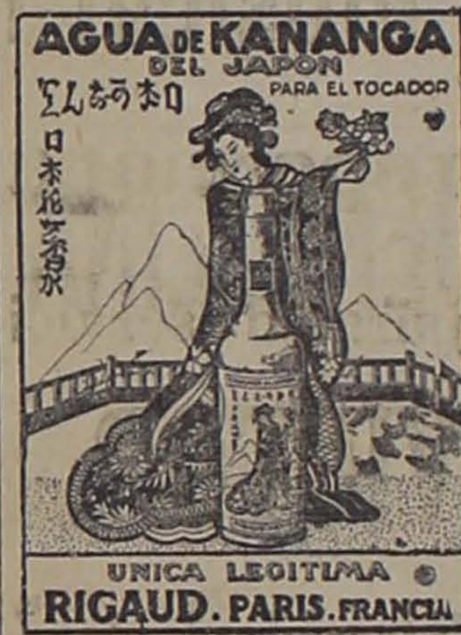
UNICA LEGITIMA RIGAUD. PARIS. FRANCIA