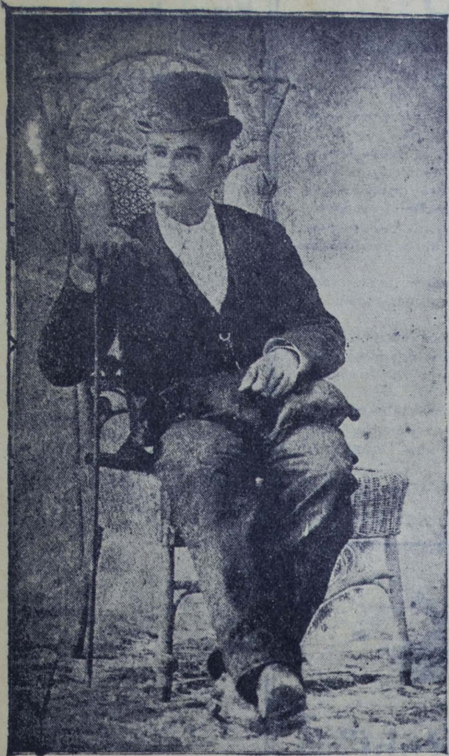
Aspecto poco conocido de Alberto Masferrer. Plena juventud física del maestro. Vestido según la moda de aquellos tiempos. Empezaba a extenderse su prestigio en el campo de las letras. Ejercía el Magisterio.

EL estar distanciado por el dogma y las convicciones religiosas, no impide rendir al eximio esteta Alberto Masferrer el tributo de nuestra admiración por su concepción de vida, acoplada a un estoicismo con mansedumbres de paloma y a una palingenesia con asíntotas de eternidad. Puede que ello sea intrascendente, sí, pero para los que disienten del ideal cristiano, acongojados por las fatalidades del vivir, es sedante y creador de estados de ánimo tan serenos que llevan a la comprensión desoladora y a la vez dulce de los arcanos que la naturaleza guarda.