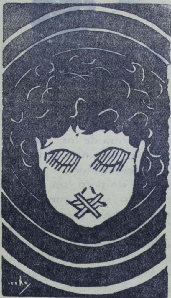
Grabado: Ilustración de Ricardo Contreras

(De "La Voz New York", Friday, march 4 the 1938.)