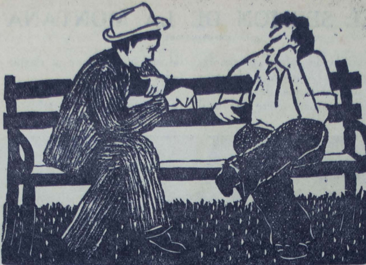
Grabado de Ricardo Contreras

Se ha desatado la peste de las dulzainas, hasta el grado de que es raro encontrar cipote que no lleve en el bolsillo una endiablada animala de las mencionadas. Las personas nerviosas están, como es natural, con los nervios hechos picadillo con la musiquita que nos persigue a to-