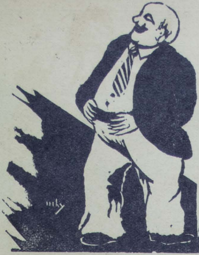
El Dr. S. P. L.

Señores, yo no les aconsejo que se bajen a escupir, pero mejor hay que tragar saliva y no salpicar a la gente. El día que al salivoso o baboso lo obligaran a bajarse a escupir se acabaría esa costumbre, tan cochina como ciertas necesidades fisiológicas, que bajo ningún pretexto ni urgencia se verifican en las camionetas.