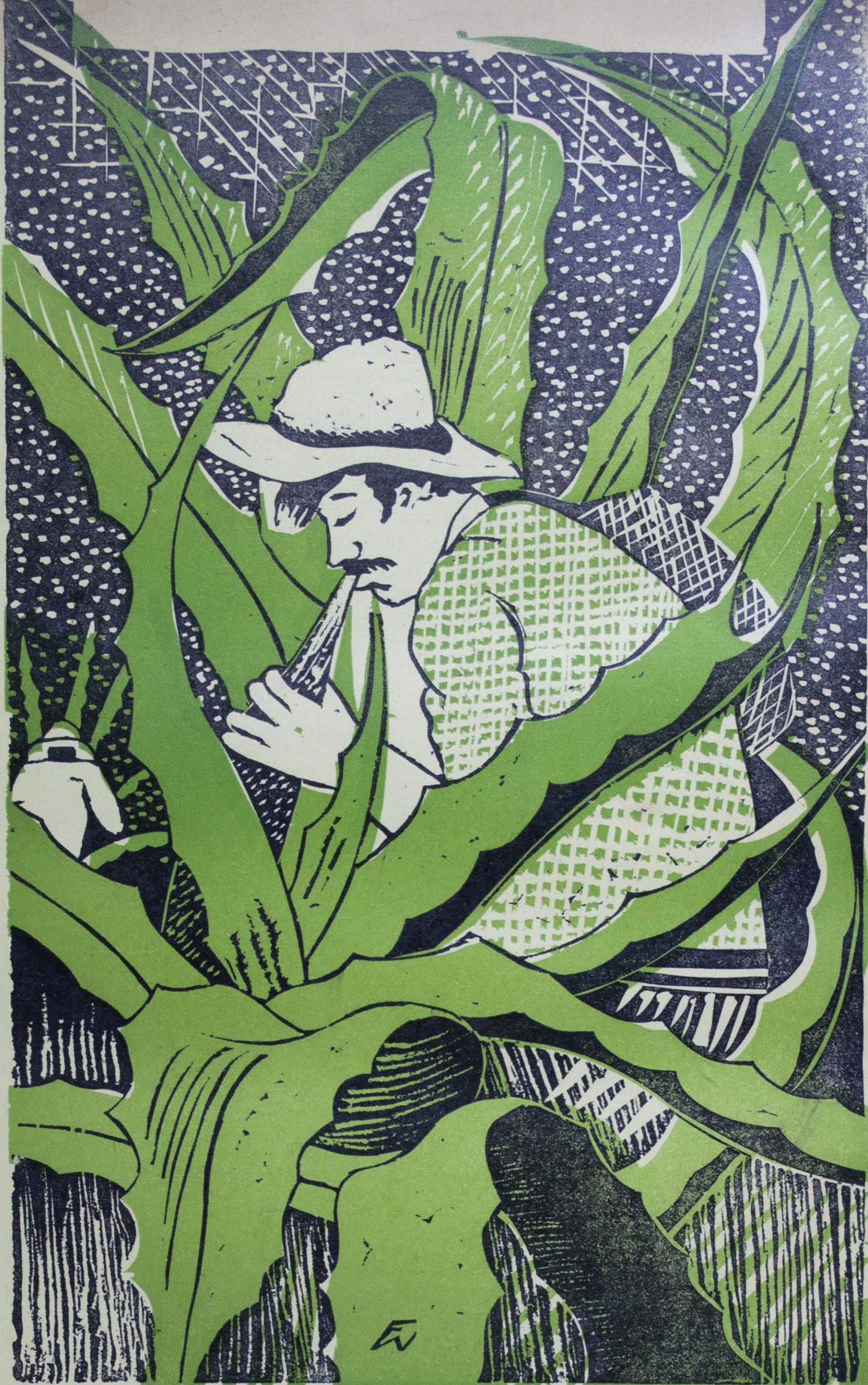
Grabado de Wenceslao Fuentes MármoL.

El maguey es para el indio como la palmera para el árabe, fuente de dones innumerables. Sus