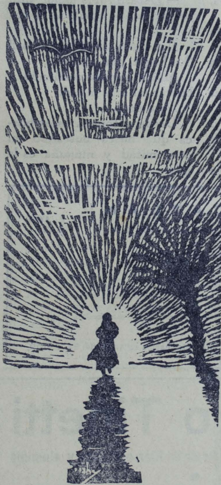
Grabado: Ilustración por Ricardo Contreras.

Una madre, con su hijo al pecho, emprendió camino por las sendas de Jerusalem.