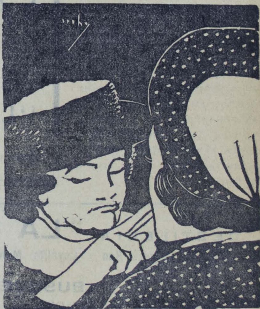
Grabado: Ilustración de Ricardo Contreras