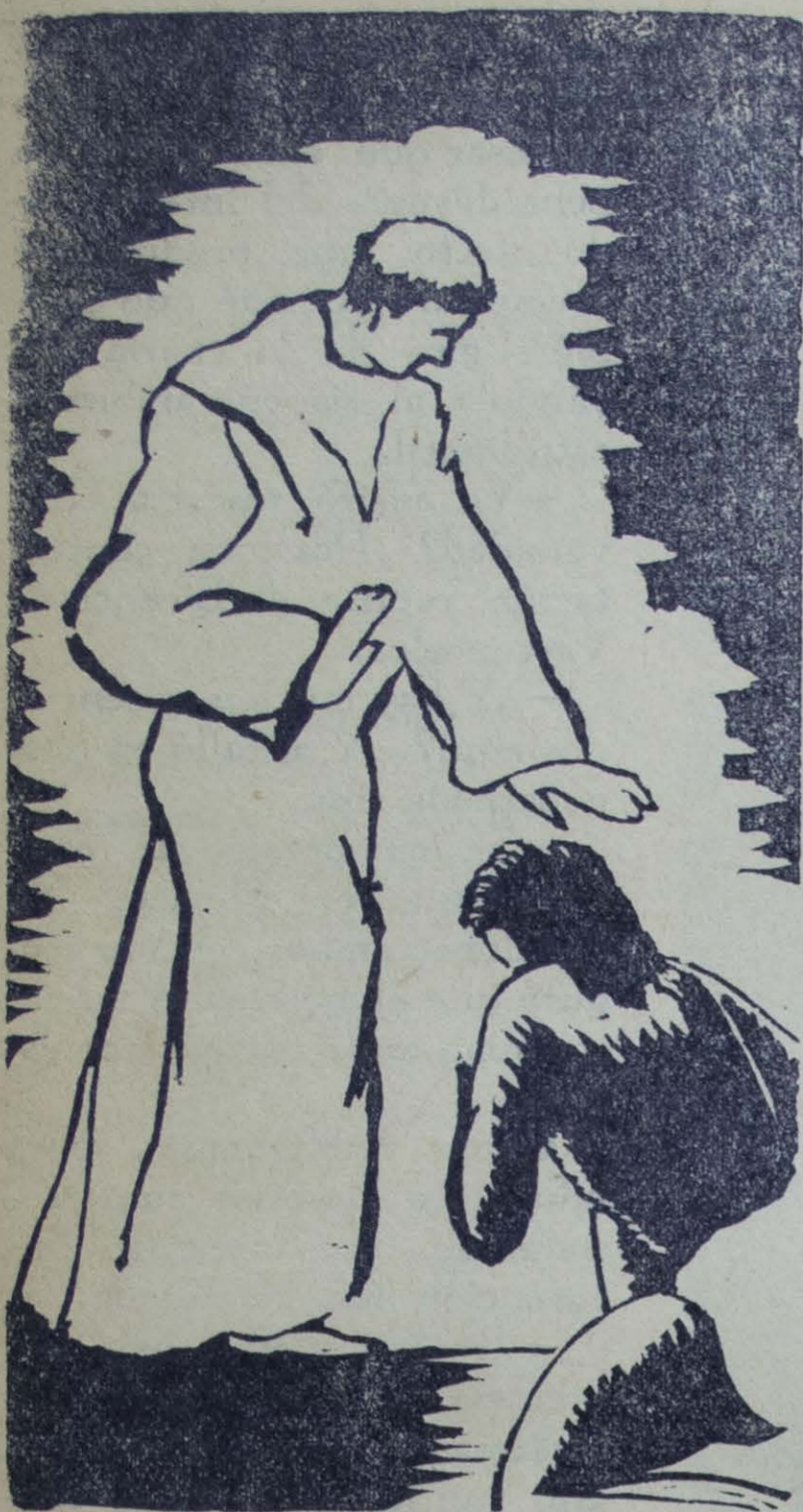
Grabado: Ilustración de Ricardo Contreras

Y la que no mira... o es ciega o no es nada.