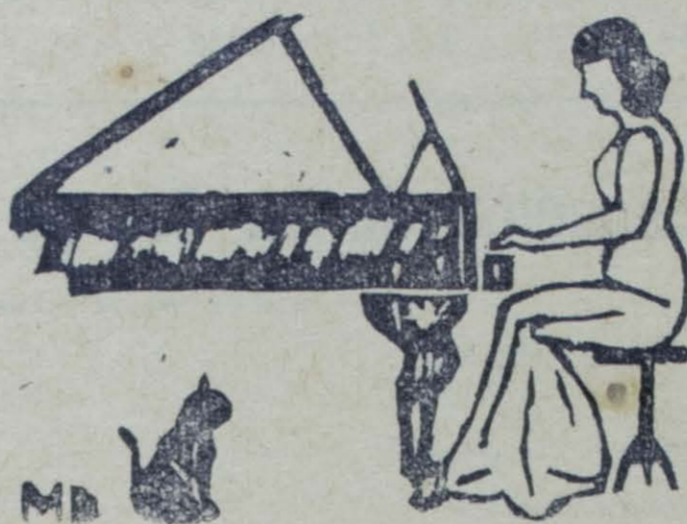
Grabado ilustración de Miguel A. Domínguez

casi todos los de casa; solamente dos niñas cosían en el corredor y yo leía en la tienda. De repente, las niñas entraron asustadas, diciendo: «Han tocado el piano y no hay nadie. Qué habrá sido?» Ellas creían en espantos y por eso temblaban. Me dirigí a la sala, encendí la luz y