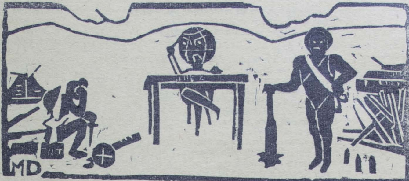
Grabado e Ilustración: Miguel A. Henríquez

ES la competencia la tónica moderna en todos los órdenes de cosas. Las gráficas informaciones del cinematógrafo nos muestran a diario rivalidades en pugna, desde el músculo férreo en los torneos deportivos hasta la línea suave en los concursos de bellezas. Hay que ser "campeón" de algo o "reina de belleza". Y en todo ello lo que pugna en definitiva es la vanidad triunfadora con la humillación de los vencidos: acreciendo el acervo de rencores con que los hombres se regalan los unos a los otros.