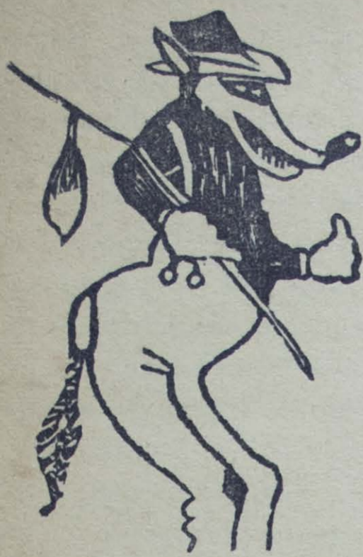
Grabado de Leocadio Barraza

¿C OMO se llamaba la heroína de este cuento tan popular, tan delicioso y tan infantil? Nadie sabría decirlo. Ni aún su madre, que estaba loca, ni su abuela, que estaba más loca todavía. En el pueblo la llamaban «Caperucita encarnada», porque siempre llevaba una caperuza de este color, y con ese nombre, tan delicioso como el cuento mismo, ha pasado a la historia.