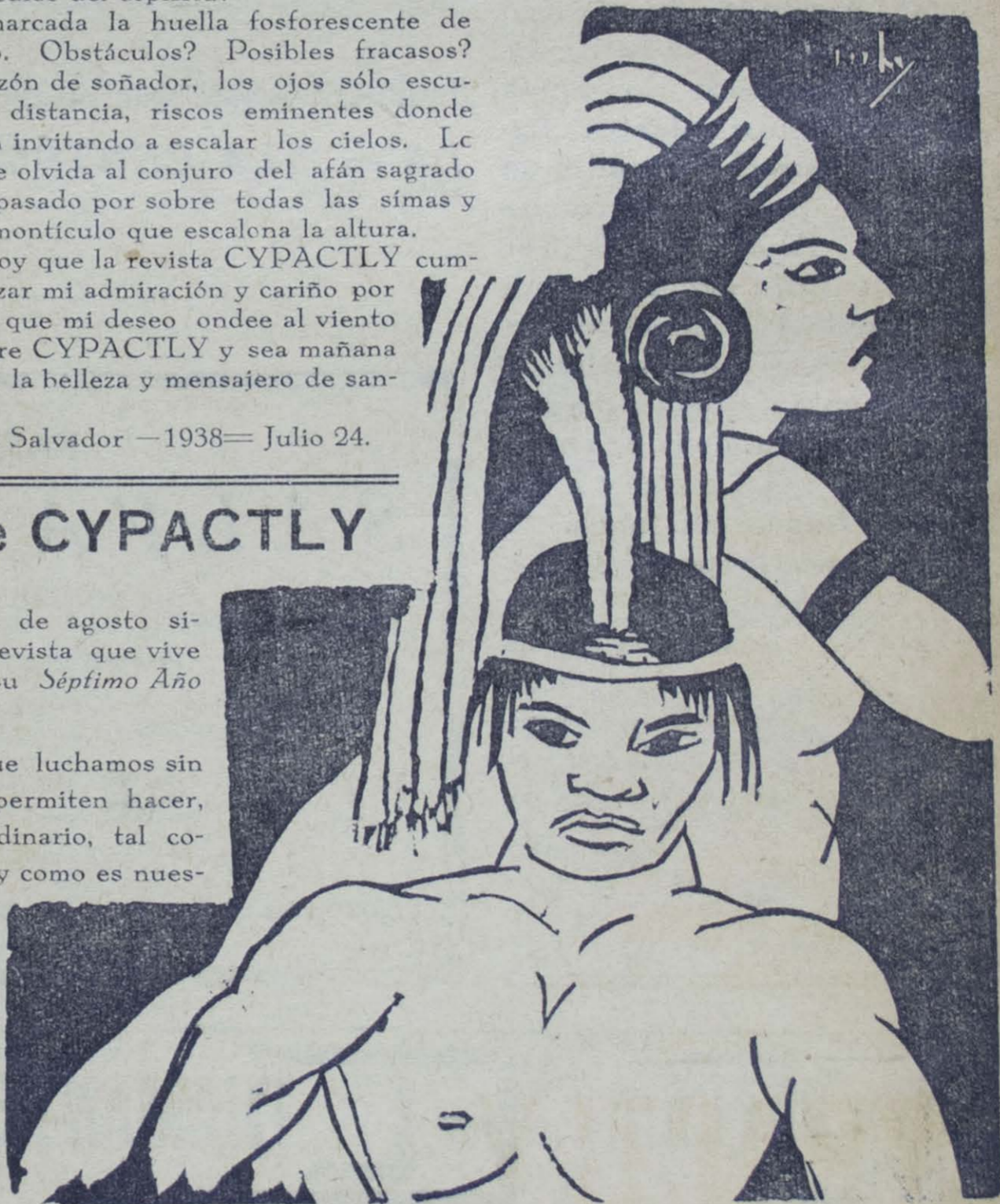
Grabados alusivos al Séptimo Aniversario de CYPACTLY, por Ricardo Contreras

Circunstancias especiales de los que luchamos sin más apoyo que el del público, no nos permiten hacer, en estos momentos, un número extraordinario, tal como lo hemos hecho en años anteriores y como es nuestro ferviente anhelo. Pero el público nos dispensará. Las publicaciones de honor, en nuestro medio, luchan con más sacrificio y fructifican en mejores productos para el regalo espiritual de quienes leen.