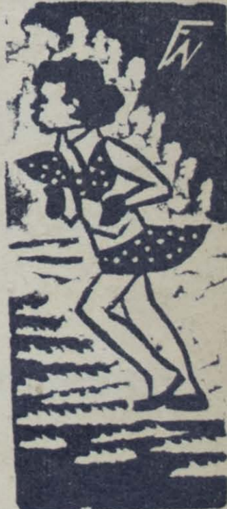
Grabados por Wenceslao Fuentes Mármol