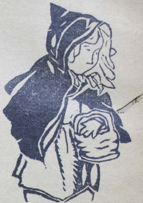
Grabado de Leocadio Barraza