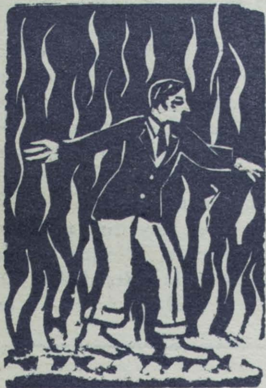
Grabado de Wenceslao F. Mármol

LA MILAGROSA inmunidad de los faquires hindúes para el fuego, ha llamado siempre la atención de los espiritistas.