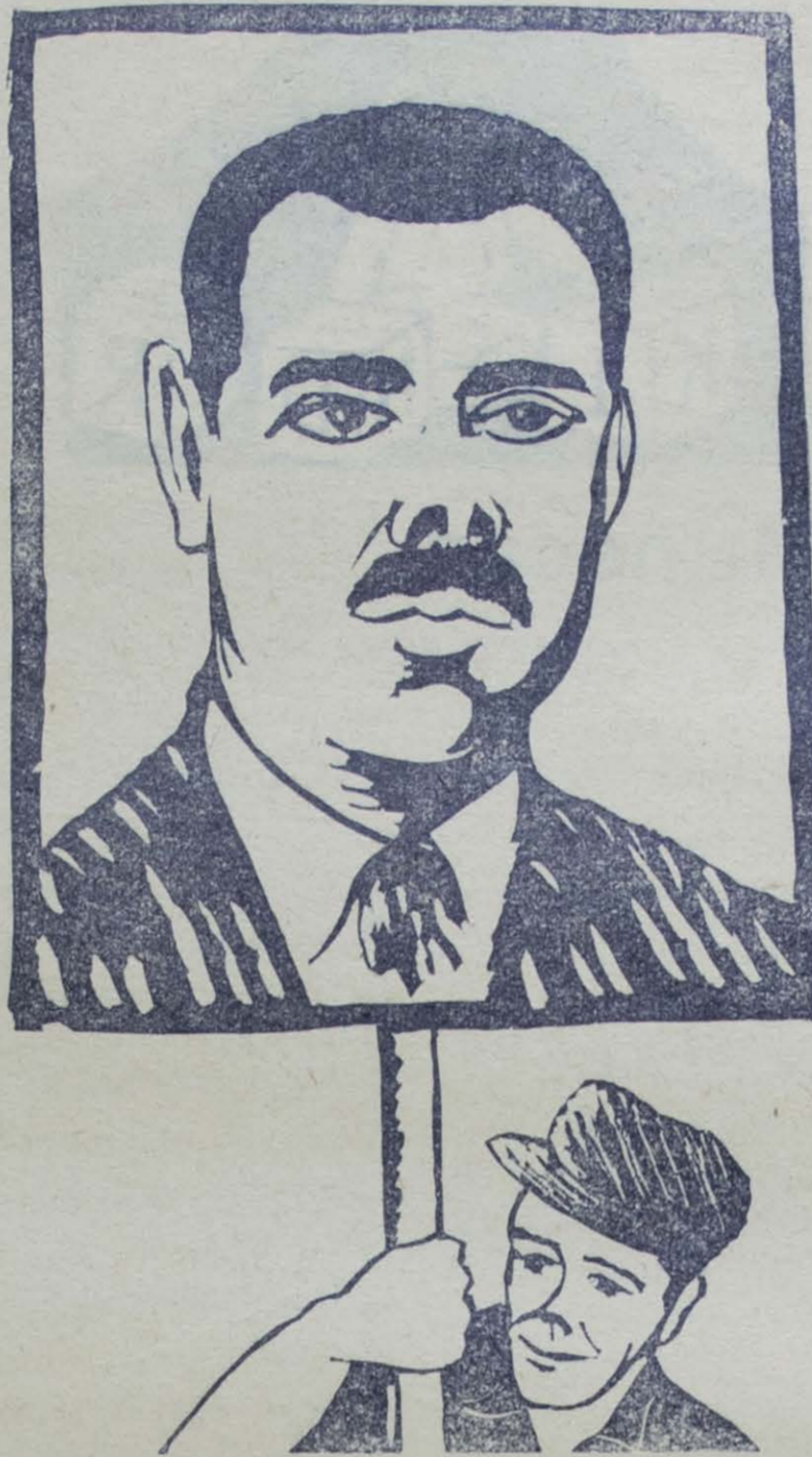
Grabado: Ilustración de Ricardo Contreras

des Islas donde todavía se respira aire puro: ahí está México fértil que camina con paso firme a la solución de sus grandes problemas. Ahí está Costa Rica. Ahí están