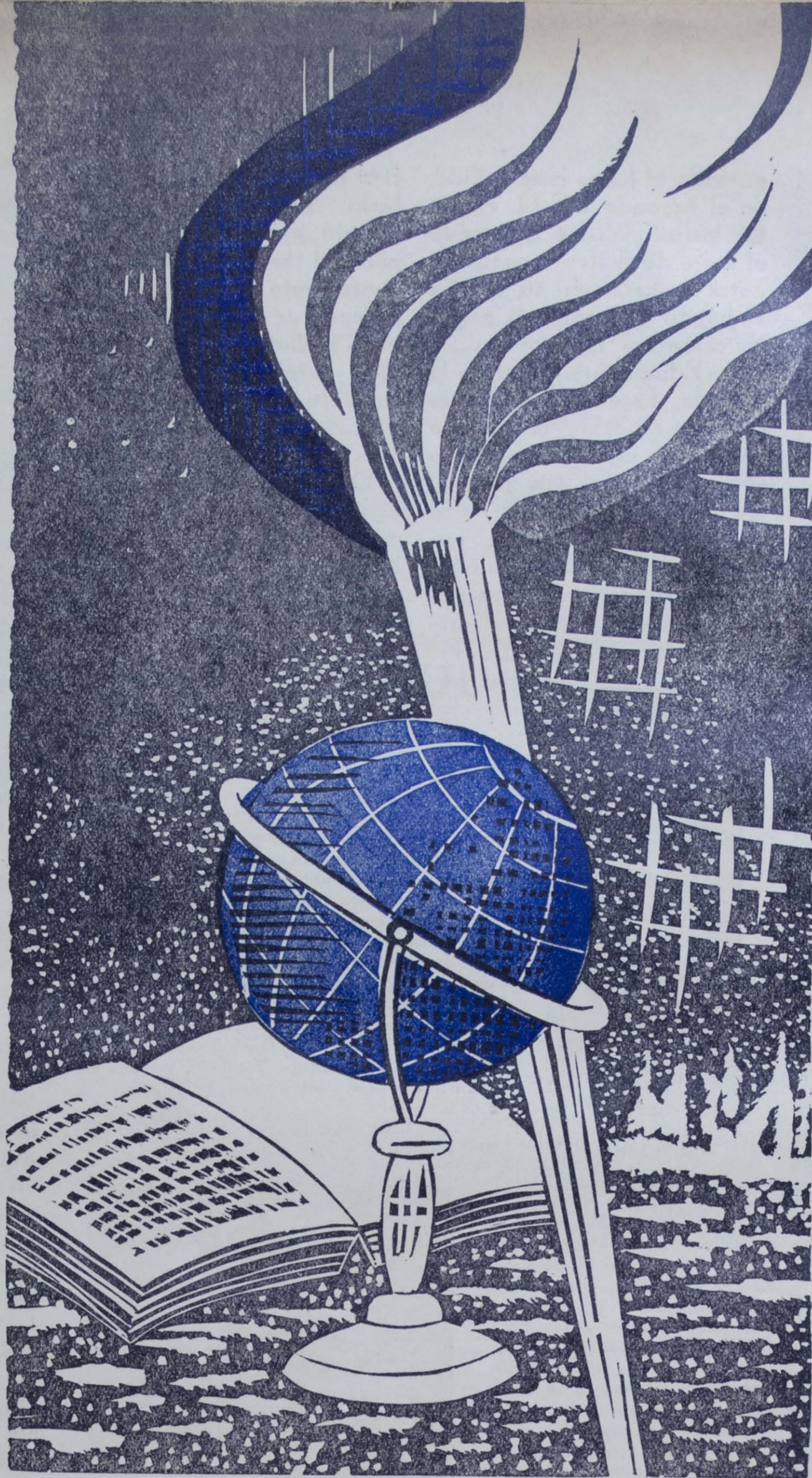
Grabado de Wenceslao Fuentes Mármol

Surgieron entonces los libros de guerra, literatura quemante que deja un acre sabor al ser paladeada. El arte reventó en las escenas sangrientas de las trin-