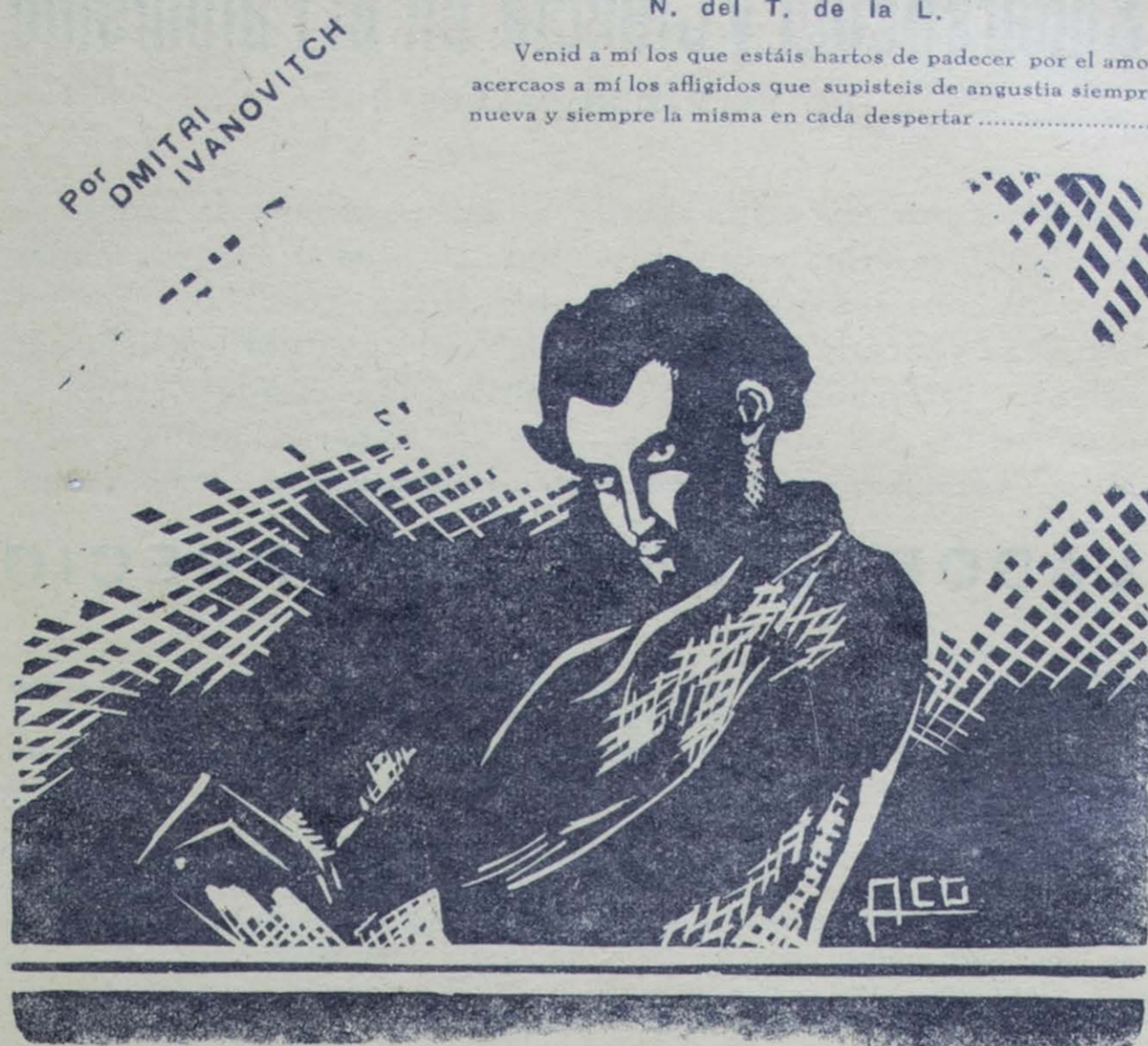
GUSTAVO ADOLFO BECQUER