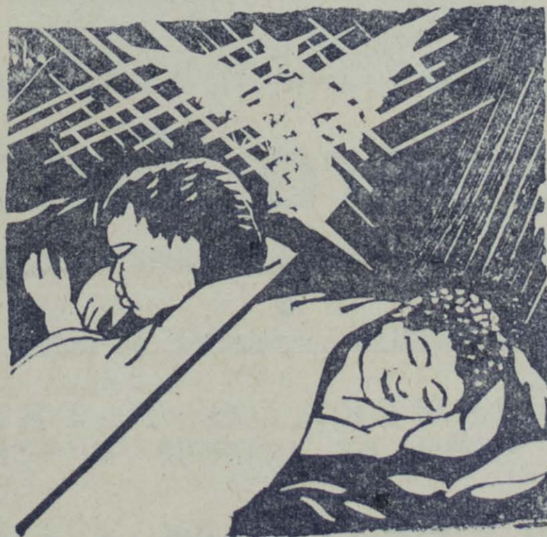
Grabado e Ilustración de Ricardo Contreras

Sabe alguien en dónde estuvo escondida tanto tiempo la dulce y suave frescura que florece en las carnicitas del niño? Sí. Cuando la madre era joven empapaba su corazón de un tierno y misterioso silencio de amor dulce y suave frescura que ha florecido en las carnicitas del niño.