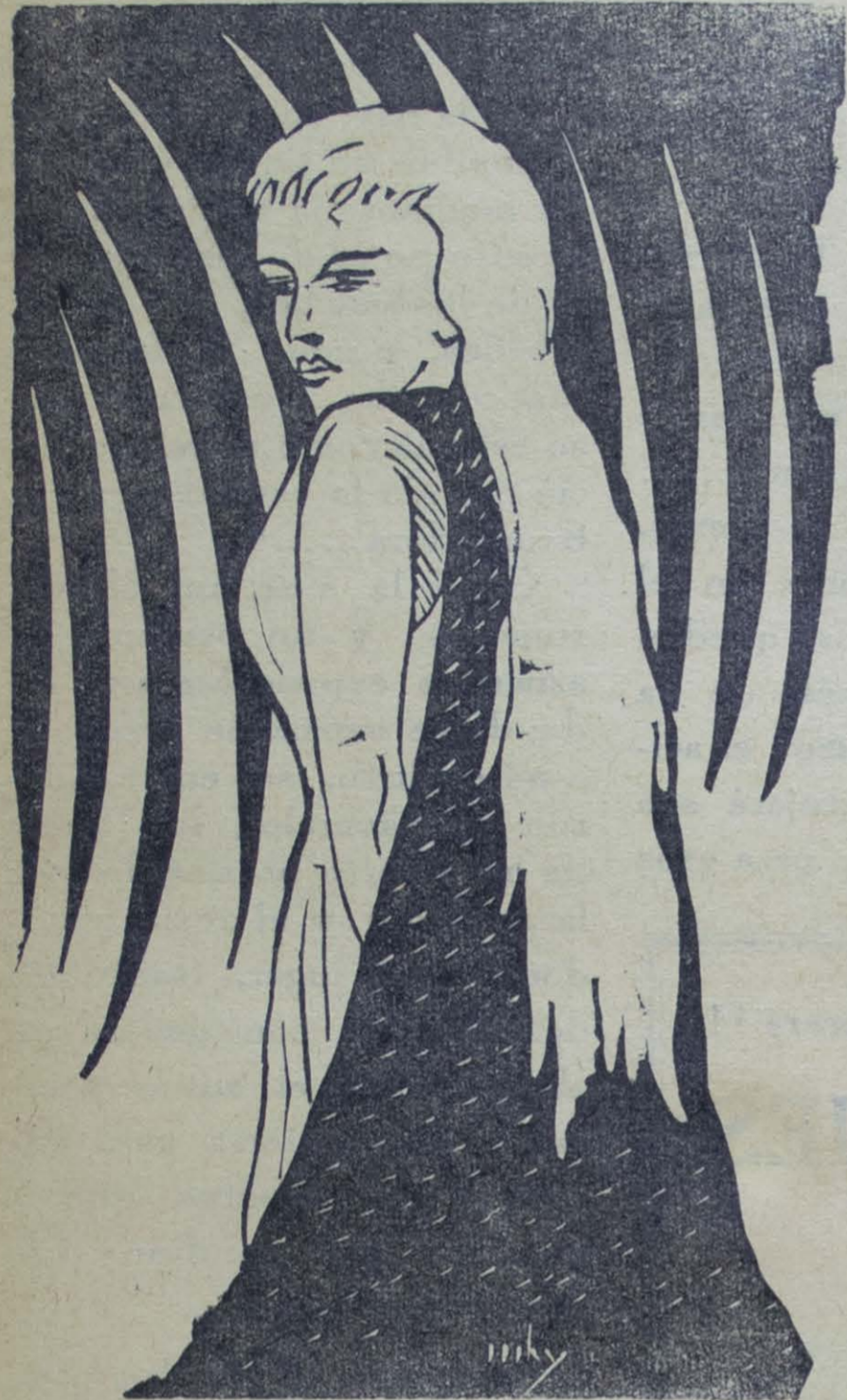
Grabado: Ilustración de Ricardo Coñeras

(Escena desarrollada en el jardín. Surtidor. Aroma. Brisa. Color)