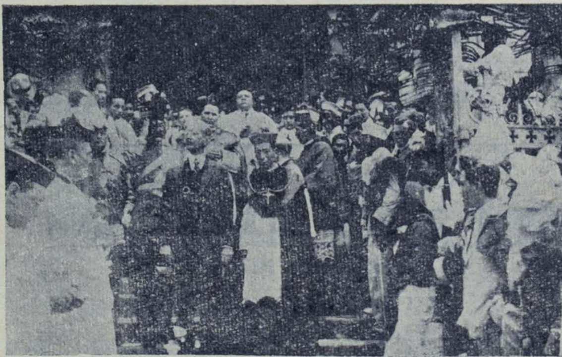
CUANDO MONSEÑOR BELLOSO FUE CONSAGRADO OBISPO DE SOSUZA. — Fotografía histórica de cuando Mons. José Alfonso Belloso y Sánchez fué consagrado Obispo. Bajando las gradas de Catedral, el dignatario de la Iglesia es acompañado por el entonces Presidente de la República don Jorge Meléndez.

Se trataba de un homenaje que los obreros presentaban a Su Señoría. No indagamos el motivo. Quizá era el cumpleaños de Monseñor Belloso. Tomó la palabra uno de los visitantes para ofrecer al Pastor sus ofrendas. Contestó