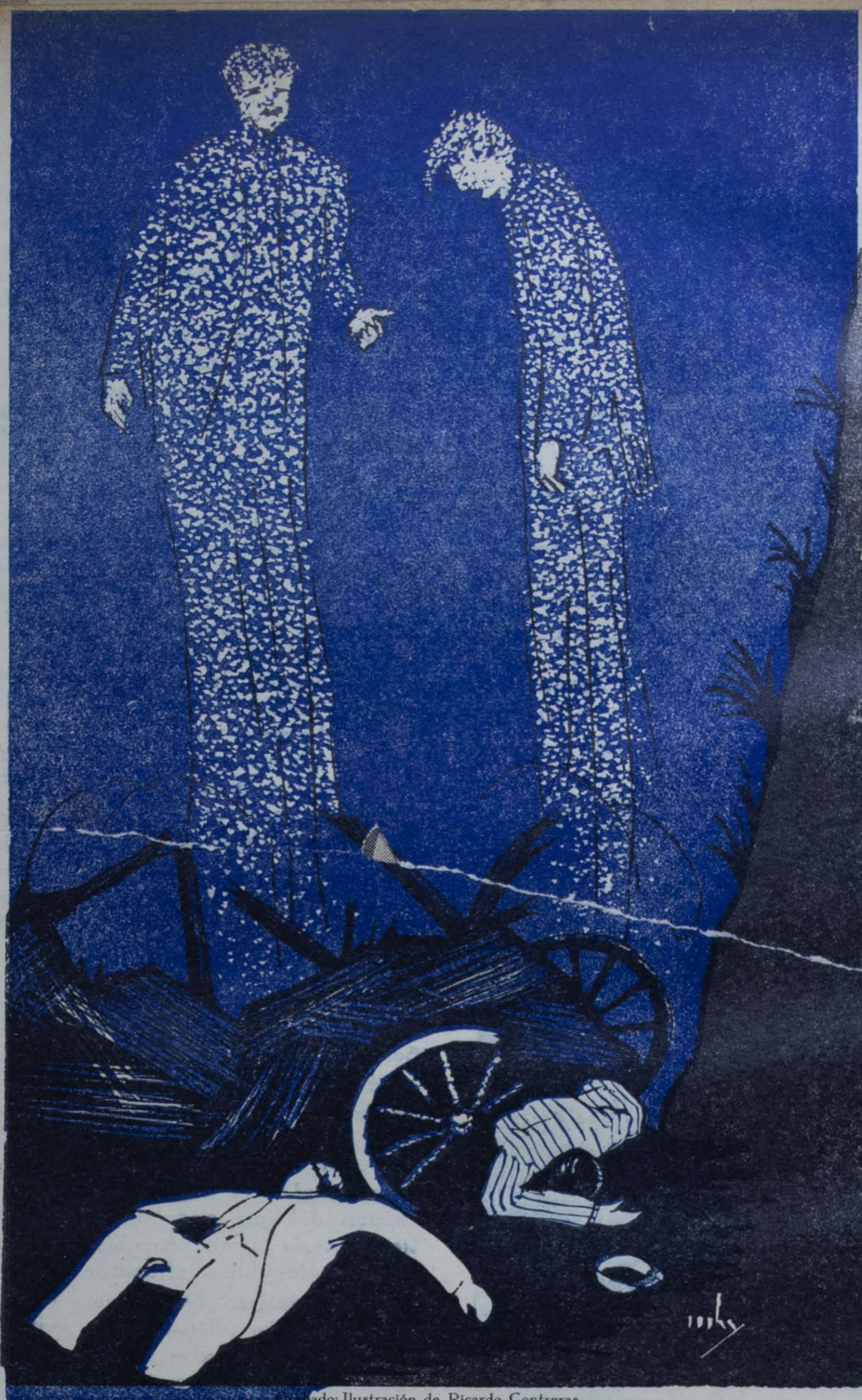
Ilustración de Ricardo Contreras