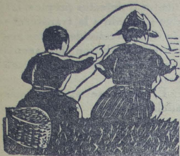
Grabado: Ilustración de Ricardo Contreras

M I hijo mayor, un joven de 21 años, abandonó mi hogar hace ya tres meses. No ha muerto — como no sea para mí, que lo considero perdido. Durante los tres meses no me ha escrito una sola letra y aunque ha venido dos veces a nuestra ciudad, ha preferido parar en un hotel, sin tomarse siquiera la molestia de llamarme por teléfono. ¡Es muy doloroso! Pero la culpa es mía. Dejé escapar la oportunidad de ganarme el corazón de mi hijo, y ahora, como muchos otros padres en condiciones similares, vivo amargado por el remordimiento.