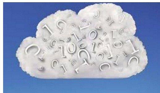
Figura 3. Representación del código binario y datos en la nube.

A ciencia cierta nadie puede predecir el futuro, las tendencias de la vida del ser humano son tan cambiantes como las estaciones del clima, pero sí es una realidad que desde los principios del nuevo milenio nunca la tecnología había revolucionado ni cambiado tanto la forma en que vivimos, el rápido y cambiante despliegue tecnológico genera un nuevo término “vida en la nube”, es decir nuestra vida diaria y trabajo está fuertemente relacionada al Internet; los softwares y herramientas que antes descargábamos a la pc hoy las tenemos disponible desde cualquier lugar gracias al auge de la tecnología móvil. Es el momento ideal para saber que lo que hagamos estará presente en todas partes del mundo, no debemos olvidar entonces que así como se usa la web para transmitir tanto contenido dañino, está la oportunidad de llevar las buenas ideas y los mensajes positivos que se quiere que la gente lea, vea y escuche.