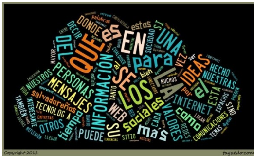
Figura 2. Nube de palabras generada con una aplicación que ilustra las palabras más usadas en este artículo.

Sin embargo existe el riesgo que un mensaje de valor se pierda entre la multitud de ideas en las redes sociales o entre los muchos correos que a diario circulan en las bandejas de entrada; y uno de los mayores problemas de esta era es la saturación de información, las personas reciben más de lo que pueden procesar en un día, continuamente las personas se encuentran con la tarea de clasificar y darle valor a lo que es más relevante para ellas.