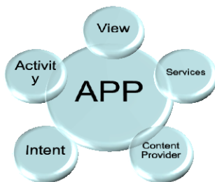
Figura 3. Representación de los componentes que conforman una Aplicación para Sistemas Operativos Android

Android además proporciona librerías que permiten incorporar en el desarrollo de aplicaciones la manipulación de archivos y bases de datos, sockets para la comunicación de red, una API muy avanzada para el manejo de multimedia, Sistemas de Posicionamiento Global (GPS),