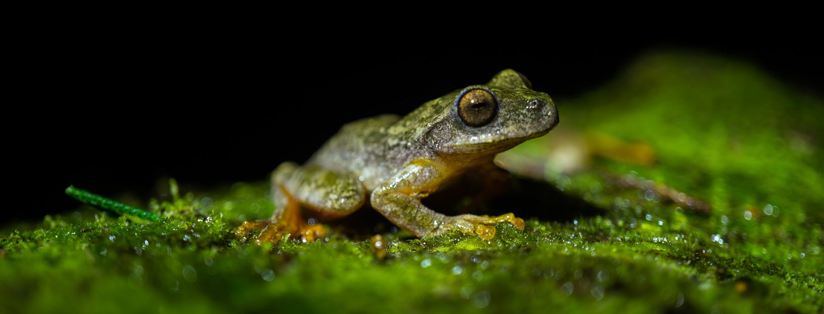
Figura 3. Ranita quebrada, Ptychohyla salvadorensis , especie amenazada.

mar (Figura 4), dichos organismos que son especialistas en su dieta generalmente consume una sola especie de alga presa (Behrens, 2005), esto pone vulnerable a las más de 30 sp., que hay en nuestras costas.