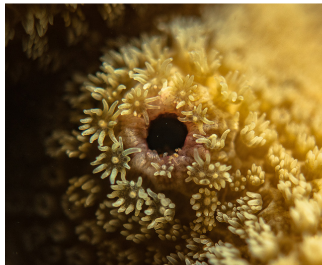
Figura 2. Pólipos de coral duro, Porites lobata .

Existen brechas que aún no se toman en cuenta, hay grupos que no son incluidos como las babosas de