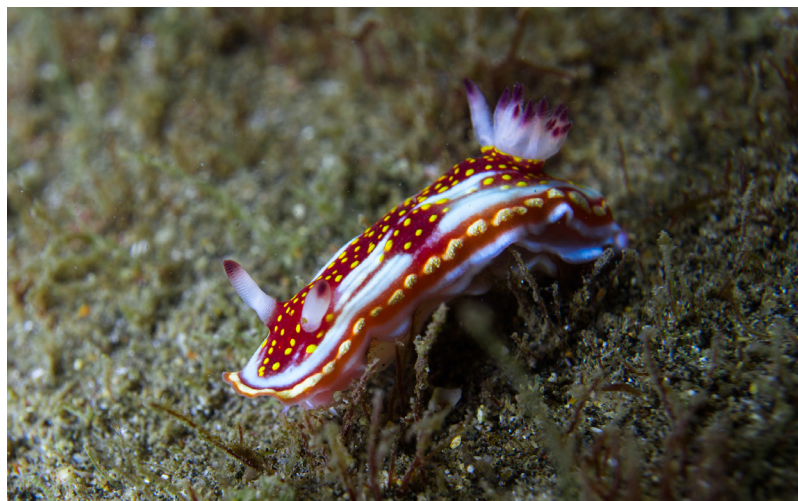
Figura 4. Babosa de mar, Felimida sphoni .

«La protección de la biodiversidad no solo beneficia a las especies en peligro, sino que también salvaguarda los servicios ecosistémicos que son vitales para nuestra propia supervivencia».