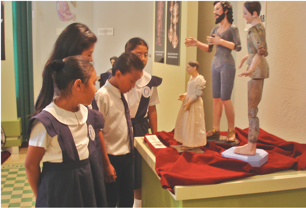
Sala Temporal, MUA

mos cultos o que, por lo menos, “nos estamos culturizando”. Pero ¿qué pasa con nuestra cultura local y nuestros museos? Con frecuencia suelo hacerme estas preguntas: ¿por qué la mayoría de nuestros museos aburren al visitante? ¿Por qué la gente dice que basta con ir una vez al museo? ¿Qué es lo que necesitan nuestros museos; promoción, oferta, respaldo económico? Las respuestas no se pueden dar a la ligera; y creo que en especial, para ser responsables ante estos interrogantes, debemos estudiar con más ahínco el fenómeno de los museos en nuestro país, su historia, sus aciertos y desaciertos; medirlos en cuanto a los logros alcanzados. Aunque esto supone ir más allá de comparar los datos estadísticos de visitantes, puesto que no solamente por ser el más visitado un museo se convierte en el mejor o en el más grande. Tampoco es el activismo cultural lo que nos llevará a alcanzar esa utopía tan perseguida de ser un museo ideal. ¿No será que nos hemos puesto a crear museos sin haber reflexionado de qué modo podemos incidir en la sociedad por medio de estos como entes ideológicos, para orientar la cultura salvadoreña hacia valores mas humanos y prácticos? ¿Qué ofrecen nuestros museos?, ¿conocimiento aislado?, ¿pura información sin que el espectador o visitante pueda conectarla con la realidad? Y unas preguntas más: ¿Los museos salvadoreños tienen contacto con su realidad y con la comunidad que les rodea? ¿Cuál es la incidencia