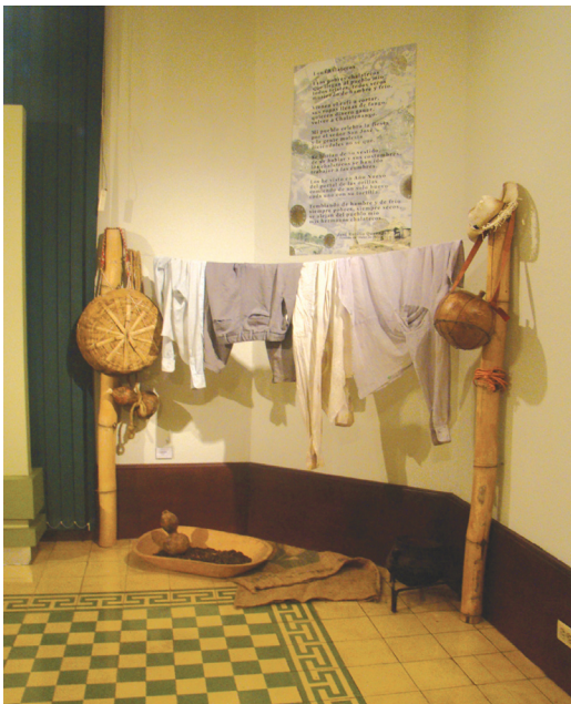
Sala Temporal, MUA

Sin embargo, estos países fueron los primeros en cuestionar el concepto tradicional de museo , y comienzan a darle rumbos más didácticos a las exposiciones y discursos museográficos, así como a extender la promoción cultural hasta el punto de crear la que hoy es una de las más rentables industrias en el mundo: el turismo cultural. Gracias a esta industria aprendemos lo que ellos designan como arte y cultura , y lo que no lo es. Nos ubicamos dentro del panorama mundial de la cultura como pueblos tercermundistas, con