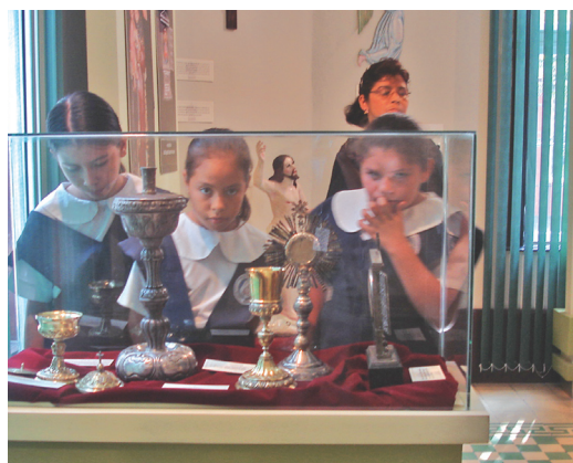
Sala temporal, MUA

En tiempos recientes el concepto de museo no solamente ha sido cuestionado, sino también ha venido cambiando, de ser una institución ensimismada, cerrada, a una más dinámica y colaboradora con otras instituciones dedicadas a la educación y la divulgación de valores de cambio en la sociedad moderna (llámense escuelas, institutos, universidades o ministerios de educación pública).