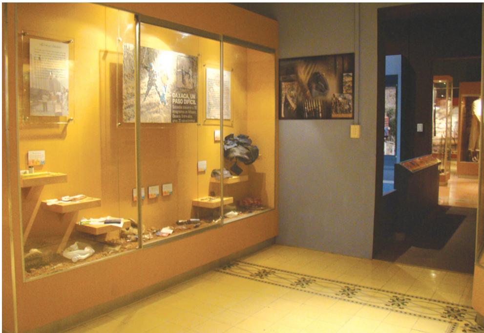
Sala "Las migraciones", MUA

Si se habla de que el museo no solamente debe conservar una colección determinada, sino también en su entorno; es decir, una zona o una localidad. Entonces, la labor del museo debe de ser la de conservación del patrimonio local. Pero ¿cuál es ese patrimonio por conservar? ¿Es solamente el patrimonio arquitectónico? ¿Qué pasa con el patrimonio humano, social, con sus anécdotas, elucubraciones, preocupaciones cotidianas?... ¿De qué manera un museo inserto en un sector con mucha afluencia humana, con problemas sociales y económicos, puede tanto reflejar como contribuir al desarrollo de esa zona? ¿Qué valores debemos de fomentar en la comunidad para hacer del lugar uno que sea ejemplar o, por lo menos, más tranquilo y atractivo para el visitante extranjero? Las exposiciones actuales no solo deben de tener un grado de academicismo o desarrollo de contenidos científicos, sino también han de estar dirigidas en sus temáticas a la gente que habita el entorno del museo. 2 Es necesario definir y delimitar el patrimonio tangible e intangible que el mu-