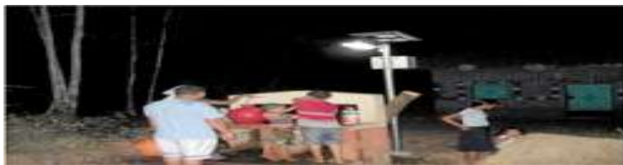
Alumbrado en una comunidad rural al oriente del país.

No, pero sí tiene su técnica. La razón es que no es alta tecnología y no se puede decir que un ingeniero salvadoreño no lo puede manejar, cómo no, inclusive mi empresa donó un sistema al Instituto Tecnológico, el ITCA de Santa Tecla, en el año 2007, para que los muchachos aprendan, como se instala, como funciona. Ya hay personal preparado para eso. No se necesitan mayores conocimientos, pero sí honradez para poderlos instalar, porque se ha visto que hay algunas compañías que andan ofreciendo muchas cosas y con un panel pequeño le dicen 'nosotros le damos energía a toda su casa, no importa lo que usted consuma' y hay gente sin experiencia que dice que 'una fábrica se puede trabajar con un panel solar', eso no es cierto, la instalación es un tema de técnica, tiene su costo, pero es accesible.