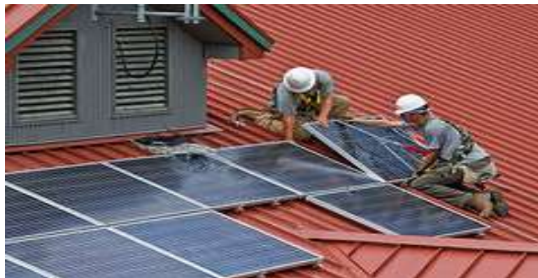
Instalación de paneles solar por obreros especializados

Los recursos son proporcionados por el Banco Multisectorial de Inversiones (BMI) y la KFW de Alemania (Kreditanstalt für Wiederaufbau).