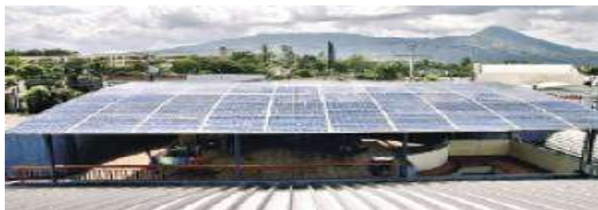
Edificio de CEL.